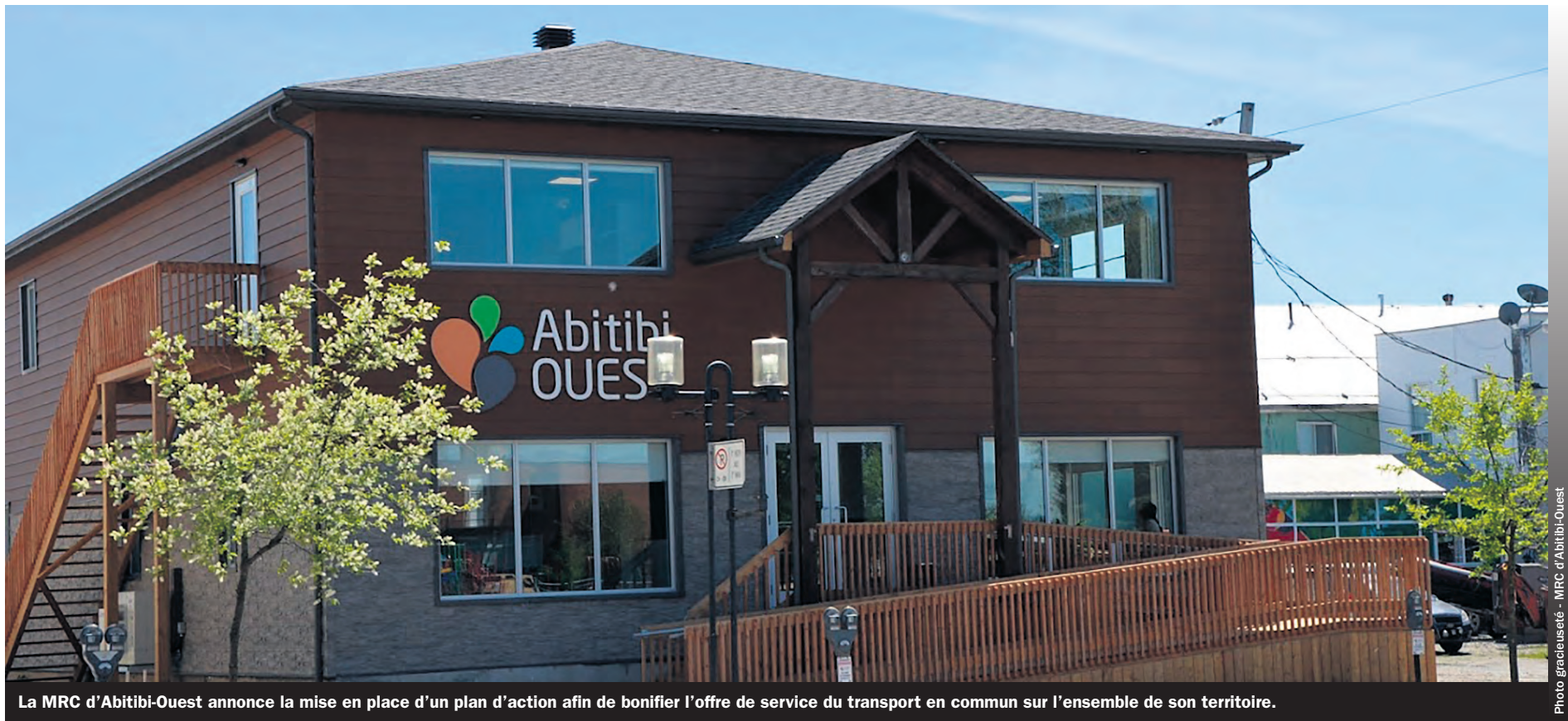
La MRC d'Abitibi-Ouest annonce la mise en place d'un plan d'action afin de bonifier l'offre de service du transport en commun sur l'ensemble de son territoire.