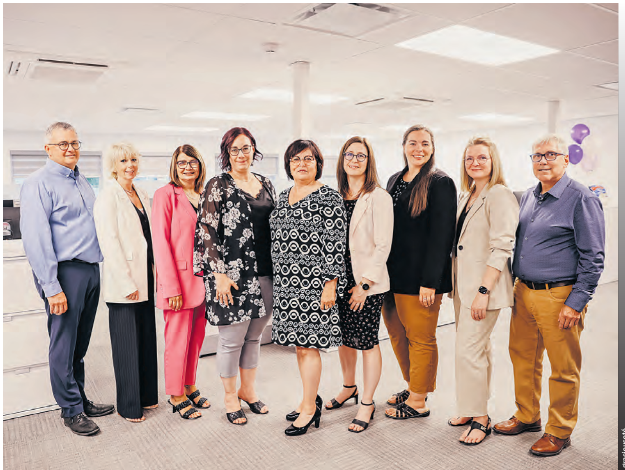
Les employés de la firme Raymond Chabot Grant Thornton.

« On démontre également à la population que nous sommes là à long terme et là pour rester. »