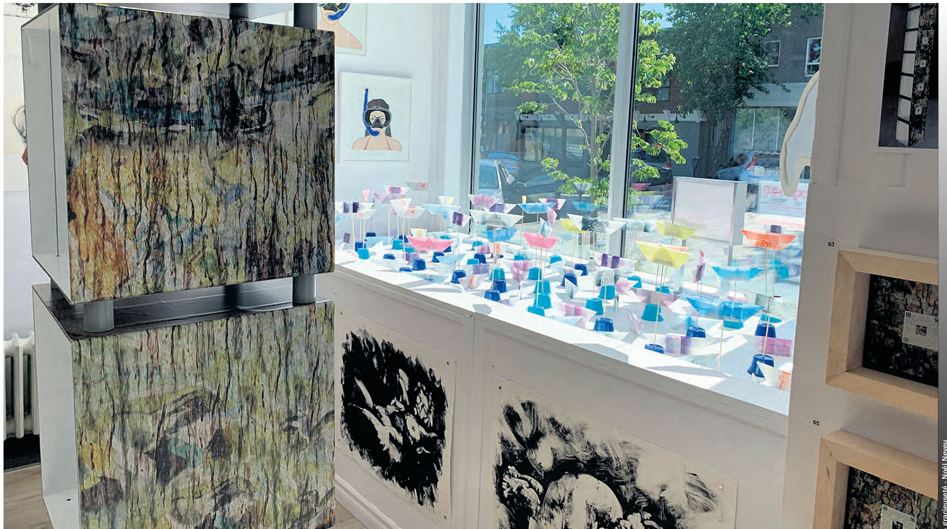
Lancement de l'exposition « Expo 40 » pour les 40 ans de l'atelier les mille feuilles