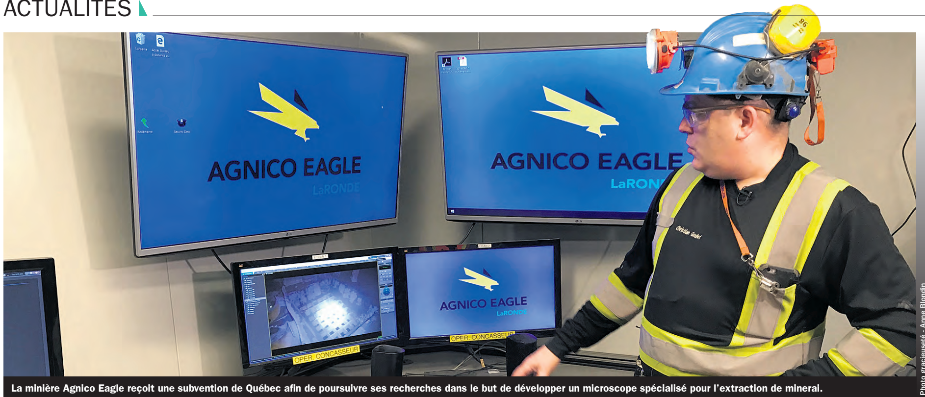
La mine Agnico Eagle reçoit une subvention de Québec afin de poursuivre ses recherches dans le but de développer un microscope spécialisé pour l'extraction de minéral.