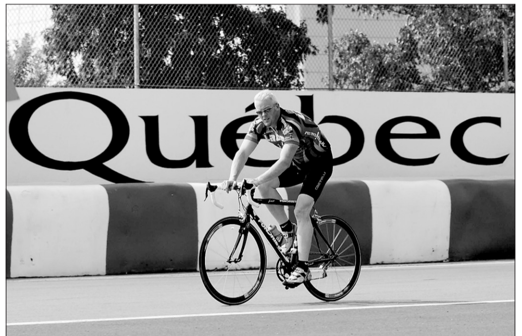
Paul Tracy, qui cherche à mettre la main sur un premier championnat en carrière, a fait d'une pierre deux coups, hier, lors d'une balade à vélo : un brin d'entraînement doublé d'une visualisation des virages du circuit Gilles-Villeneuve...

Un avant-goût de tout ça aujourd'hui, donc, sur le Circuit Gilles-Villeneuve. Vous savez comment ça marche : première séance de qualification pour la pole provisoire, avec garantie, pour son auteur, de la première ligne au départ de dimanche, en plus d'un point boni. La suite demain,