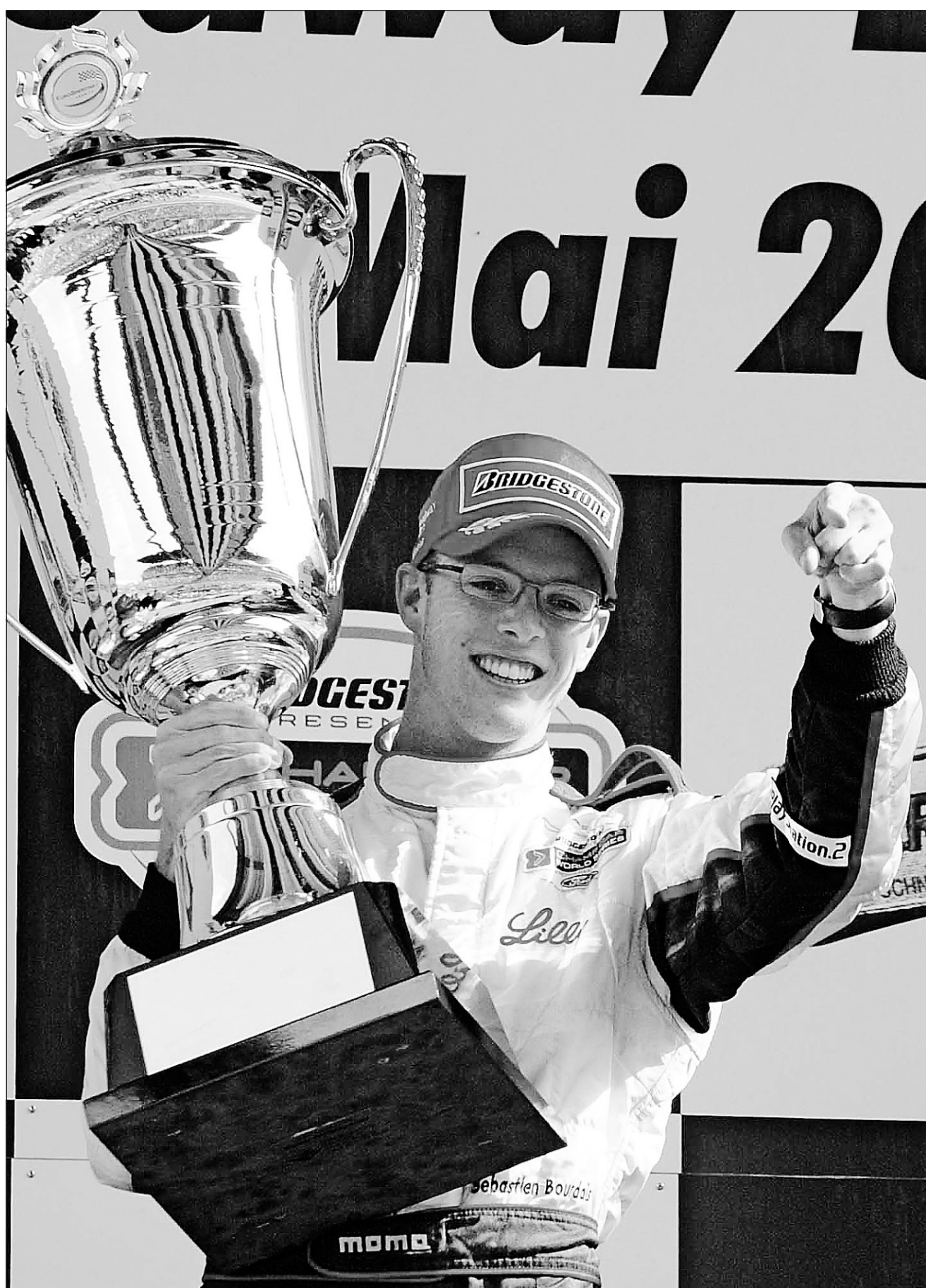
Pour le jeune Français Sébastien Bourdais, l'équation est simple : « Un bon pilote dans une bonne voiture, ça donne toujours de bons résultats. » À la veille du Molson Indy de Montréal, la recrue revendique trois victoires en série Champ Car.