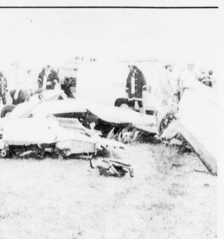
Fin d'un cascadeur

Deux mille marines, à bord de trois navires de guerre américains, sont arrivés lundi au large des côtes libanaises, a indiqué le Pentagone.