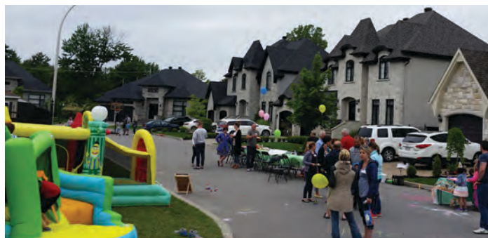
Photo de Sylvie Hassan (district Notre-Dame-de-l'Assomption), gagnante du concours photo en 2016.