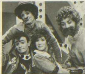
Dans un univers ultramoderne, Bulle et Filo se transportent d'une région à l'autre au gré de leur traboulisteur et rencon-

trent des personnages peu banals. Avec Sylvie Léonard et Denis Mercier. Réal. Lise Chayer. L'étoile filante.