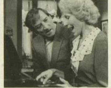
Jean Lapointe, Janine Sutto