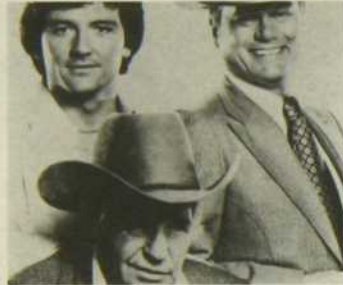
Patrick Duffy, Jim Davis, Larry Hagman