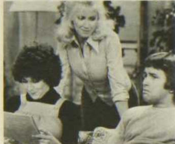
Joyce DeWitt, Suzanne Somers, John Ritter