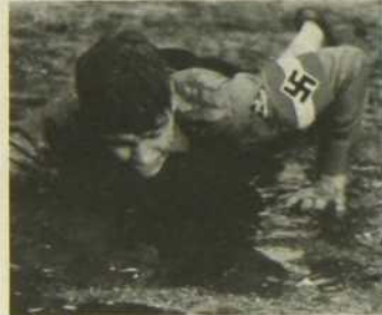
Sang et honneur