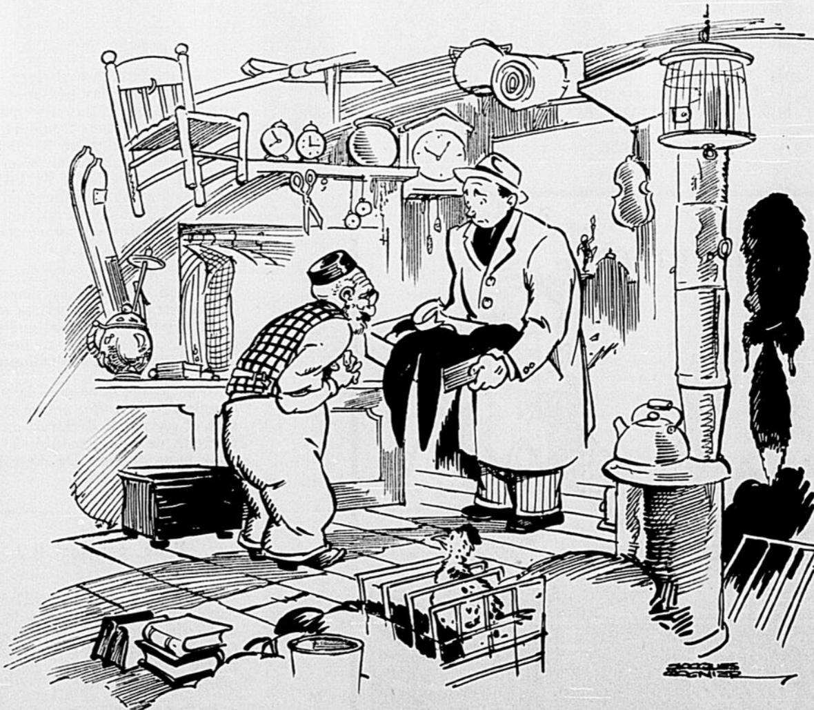
«The morning after the night before»

Autorisé comme envoi postal de la deuxième classe, Ministère des Postes, Ottawa.