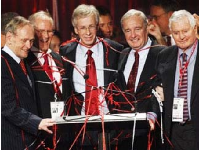
Stéphane Dion et les anciens chef libéraux Jean Chrétien, Paul Martin et John Turner

Le rêve de Stéphane Dion ne sera jamais une réalité! Le chef du Parti libéral du Canada a démissionné de son poste suite à sa défaite aux élections du 14 octobre dernier mais il entend rester en poste jusqu'en mai. Dion est un intellectuel de grande envergure et il connaît en profondeur ses dossiers. Malheureusement, il lui manque deux ingrédients, l'instinct de survie du politicien et le charisme. Il aurait dû prendre des leçons de Stephen Harper et Nicolas Sarkozy... (Voir éditorial LeStudio1.com)