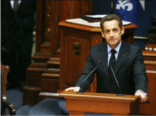
Nicolas Sarkozy - Québec

Le président de la France , Nicolas Sarkozy, s'est fait critiquer pour la courte durée de sa visite au Sommet de la Francophonie mais en plus, voilà qu'on l'accuse de favoriser le Canada plutôt que le Québec... Sarkozy est comme un père devant deux enfants qui lui demandent qui il aime le plus? Chose certaine, le président français nous aime car son mentor est Paul Desmarais . "Si je suis président de la France, c'est grâce à l'encouragement de cet homme. Il est l'un des vôtres!"