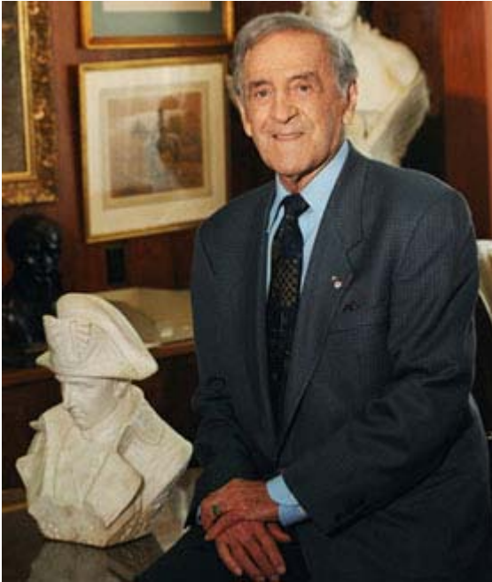
Ben Weider 1923-2008

L'équipe de LeStudio1.com offre ses plus sincères condoléances à la famille de Ben Weider , décédé subitement le 17 octobre dernier.