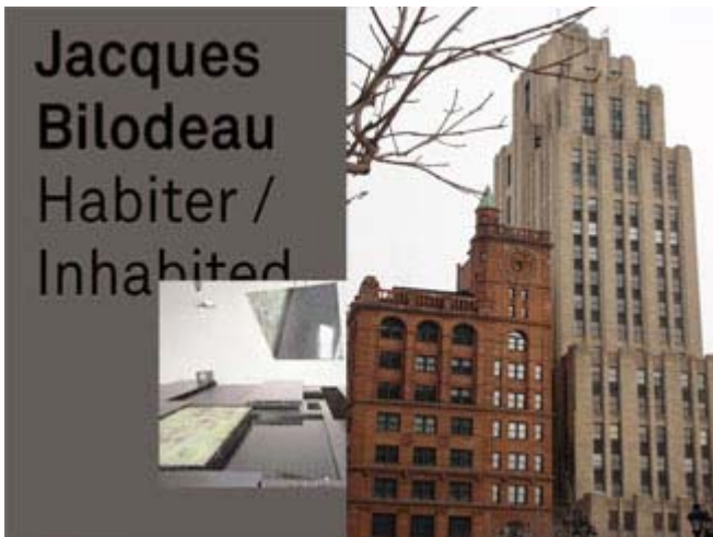
Édifice Alfred - Vieux Montréal