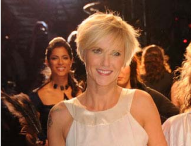
Pénélope McQuade

L'animatrice de télévision Pénélope McQuade était l'une des 23 vedettes québécoises qui ont participé à l'événement "La Diva" présenté durant La Semaine de mode de Montréal. Les artistes portaient les créations de 23 designers choisis parmi le Laboratoire créatif. Le public était invité à assister au défilé et les profits ont été remis à "Belle et bien dans sa peau". LeStudio1.com a assisté à cette présentation animée par Mitsou. (Voir reportage photo sur le site)