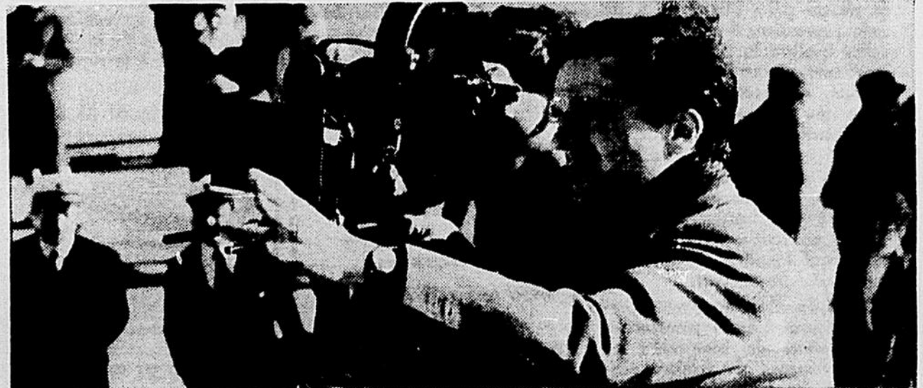
François Truffaut, tournant la "Peau Douce", un film réaliste et tendre...

Truffaut pourrait certes reprendre à son compte les propos que tenait Michel de St-Pierre dans "Les Nouveaux aristocrates": pour faire un tel film, "je vous assure, il suffit d'aimer..."