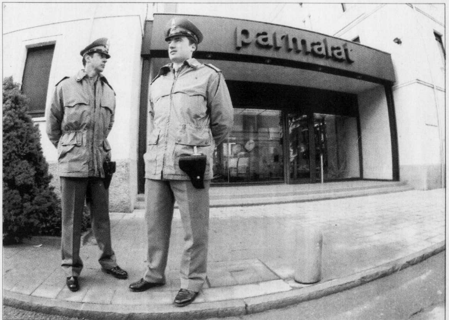
Deux agents de la police financière montent la garde devant les bureaux de Parmalat, à Parme, à la suite de la découverte du scandale financier qui a conduit, en 2004, à l'effondrement du groupe agroalimentaire italien.