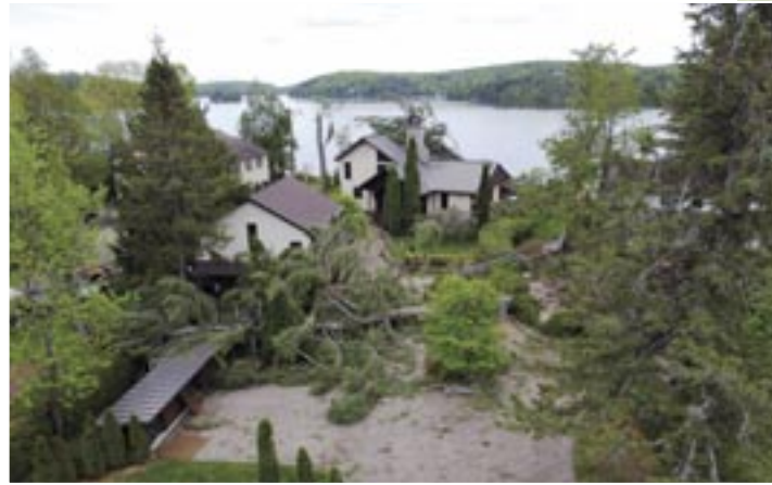
Maison endommagée au lac de L'Achigan.