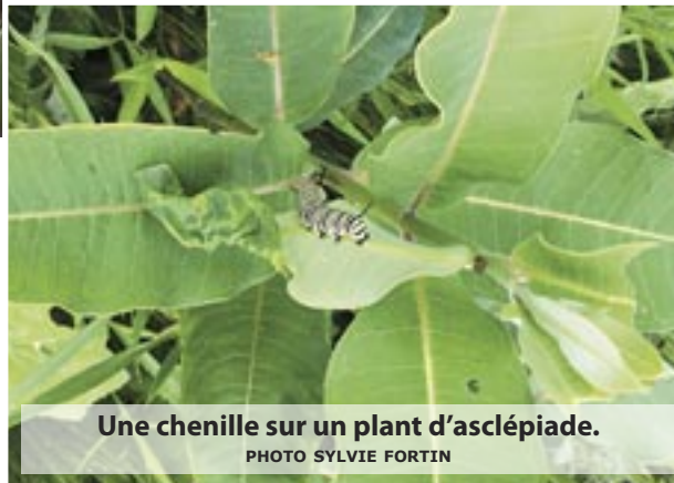
Une chenille sur un plant d'asclépiade.