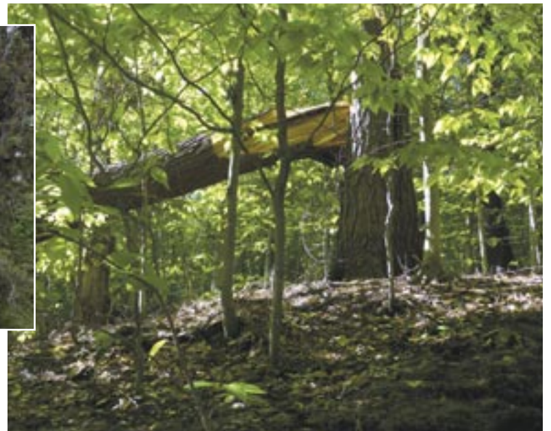
Le triste sort d'une pruche centenaire.

J'aimerais exprimer un merci spécial aux autorités municipales qui ont rendu possible