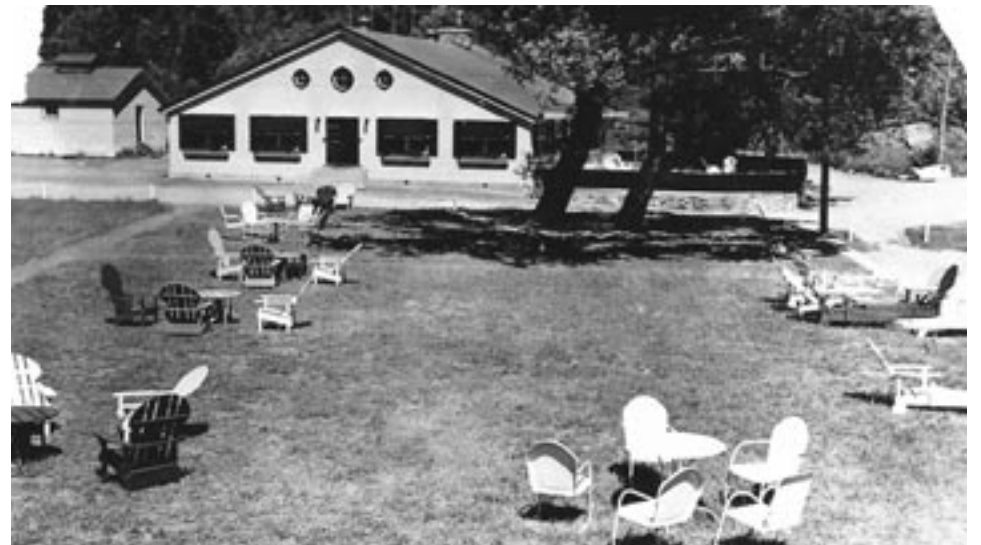
Le Pavillon et son immense terrasse tout à côté de l'Hirondelle, salle à manger.