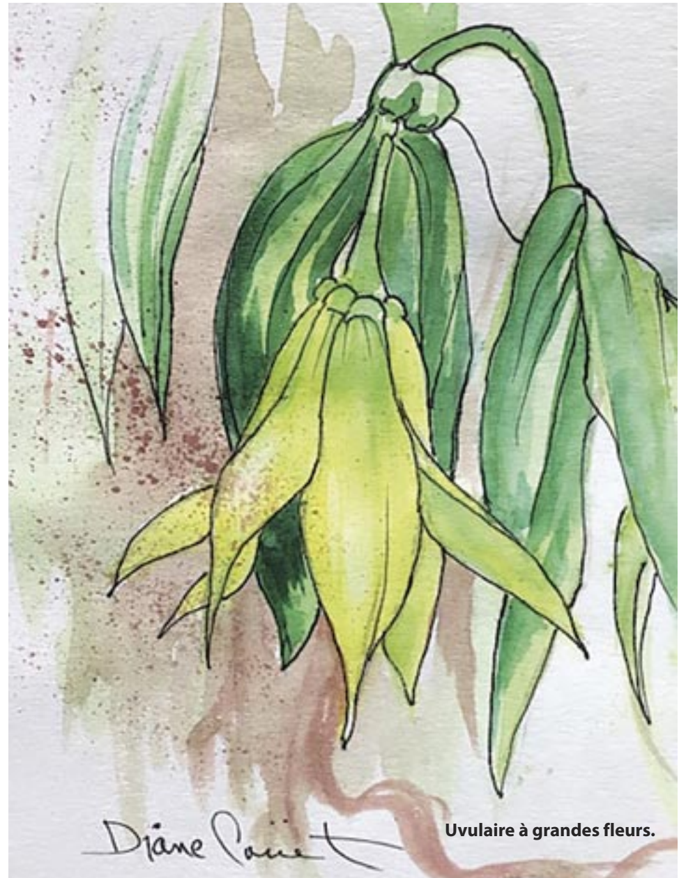
Uvulaire à grandes fleurs.

Lorsque les feuilles des arbres matures se développeront complètement vers la mi-mai, il n'y aura plus beaucoup d'espace pour que le soleil rejoigne le sol. C'est la raison pour laquelle nos uvulaires croissent et fleurissent dans la première quinzaine de mai. Par la suite, ces plantes produiront leurs fruits et faneront tranquillement. Les