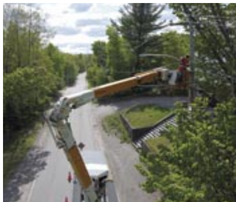
Peuplier sur un fil électrique du chemin du lac Bleu.

Pour que ce cocktail puisse prendre forme, il faut des masses d'air chaud et froid qui se rencontrent et s'entrechoquent, créant ainsi un déplacement vers le sol. Ces lignes d'orages violents peuvent parcourir des distances considérables de l'ordre de 1 000 km en quelques heures seulement. Le vent et la pluie se sont donc abattus violemment tout près du sol fauchant et essouchant des arbres, arrachant