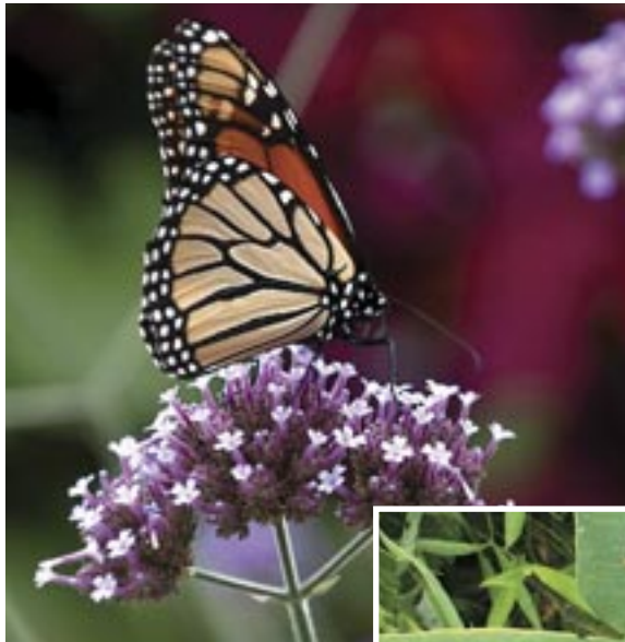
Un monarque sur une fleur d'asclépiade.