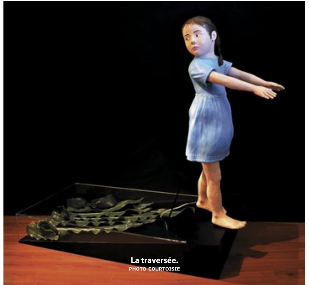
La traversée.