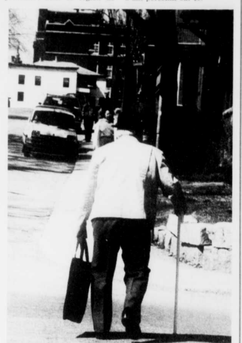
Au pays, entre 1961 et 1986, la proportion de personnes âgées de 65 ans et plus est passée de 7,6 à 10,7 pour cent. La tendance est la même dans la région de Sherbrooke.

— Le nombre moyen de personnes par ménage est de 2,6 dans les régions de Sherbrooke, Montréal et Trois-Rivières, de 2,7 dans la région de Québec et de 3 personnes dans la région de Chicoutimi-Jonquière. En 1961, on retrouvait en moyenne 4 personnes par ménage.