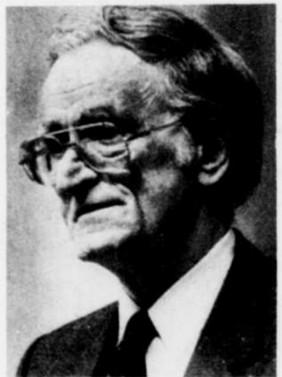
Le ministre Claude Ryan

Nous demandons à la population d'appuyer nos démarches en envoyant une lettre d'appui au dit Comité (...). Nous croyons que cette situation que nous vivons n'est pas seulement un problème de formation. Lors de notre rencontre le 21 mars dernier avec l'attaché politique de M. Claude