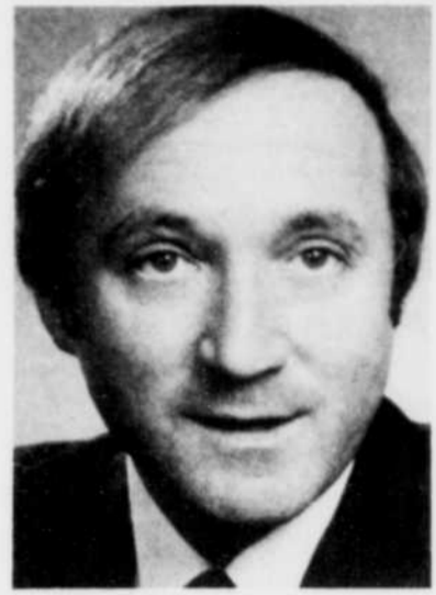
Le ministre André Bourbeau

Nos personnes handicapées physiques sont desservies par le "Transport du Bonheur Inc." que