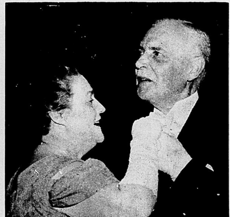
• Aussitôt devenu premier ministre du Canada, l'hon. Louis St-Laurent a déclaré qu'il devrait apprendre la danse pour remplir ses obligations sociales. On le voit ici avec son épouse en frais d'apprendre sa leçon de danse!