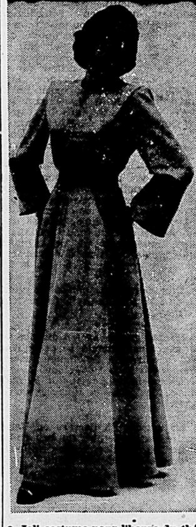
Joli costume pour l'heure du thé.