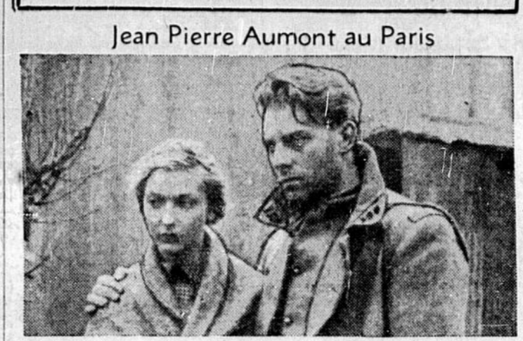
Corinne Luchaire et Jean Pierre Aumont dans une scène du film: "Je l'attendrai", dès samedi à l'écran.