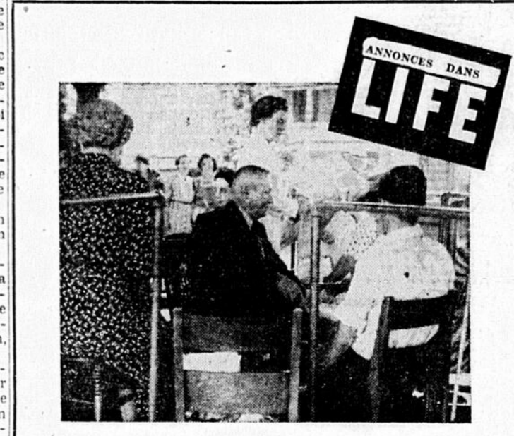
Lisez dans la revue "LIFE" la merveilleuse histoire des