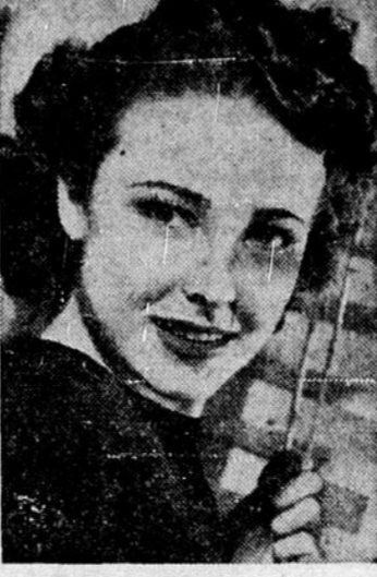
Laraine Day, vedette du film "Mr. Lucky" avec Cary Grant, actuellement à l'affiche.