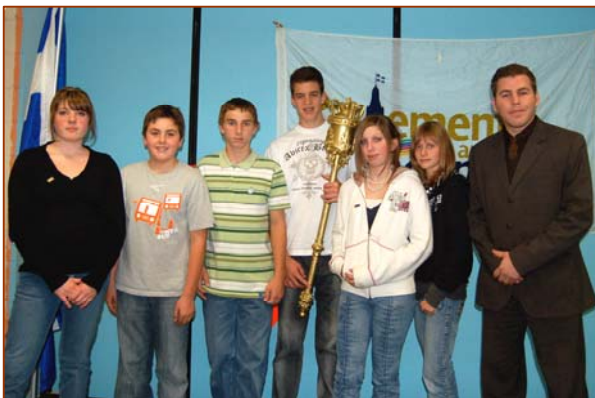
Les représentants élus au Parlement étudiant en compagnie du député, monsieur Pascal Bérubé.

Le Centre Champagnat est un centre d'éducation des adultes très actif; son site web en est la preuve. Osez le voir, ça vaut le détour!