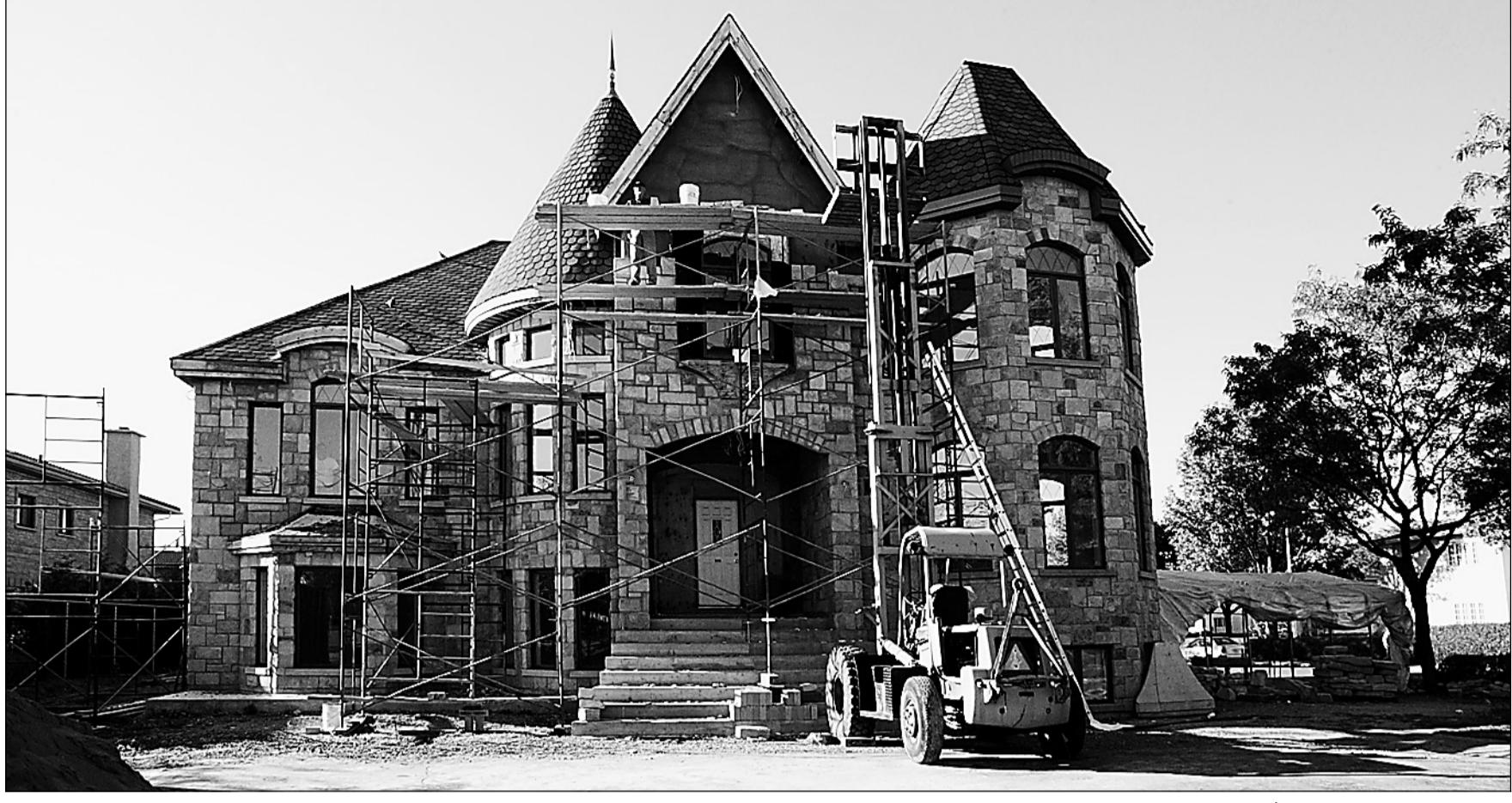
Une maison monstre en construction à Saint-Léonard.

Une petite erreur s'est glissée dans la brève sur l'exposition Chez-Soi/Home, qui présente des oeuvres d'enfants vivant à Parc-Extension. L'exposition sera présentée du 16 au 27 novembre à l'Organisation des jeunes de Parc-Extension (PEYO, www.peyo.org) et non les 16 et 17 novembre. Nos excuses.