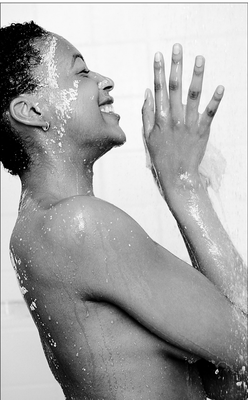
Facile et rapide, la microdermabrasion cosmétique est plus économique que des cures en cabinet d'esthétique.