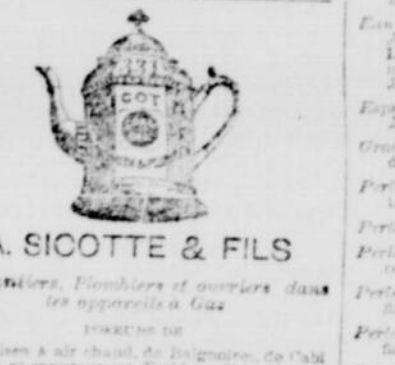
A. SICOTTE & FILS