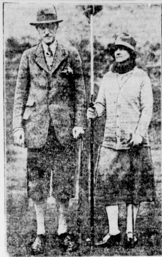
Voici une photographie de LORD et LADY WILLINGDON, prise récemment au club de golf Ancaster.

Québec, 25.—Il est maintenant admis que le moyen le plus pratique et le plus économique de conserver de grandes quantités de fruits et de légumes pour la consommation à la maison est d'en faire des conserves.