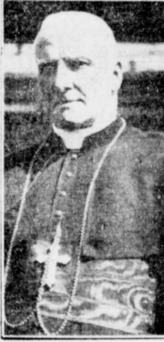
Le cardinal Patrick O'DONNELL, archevêque de l'Église catholique d'Armagh, qui succomba samedi dernier. Le vénérable prélat était né en 1858 et fut élevé à la pourpre cardinalice dans le cours de l'année 1925.