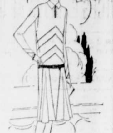
La jeune femme si occupée de nos jours ne demande pas seulement que ses robes de jour soient chères et confortables, elle veut aussi qu'elles soient faciles à porter.

Chaque paquet de 15 godets contient des directions si simples que vous pouvez de plonger pour suancer ou de faire bouillir pour teindre.