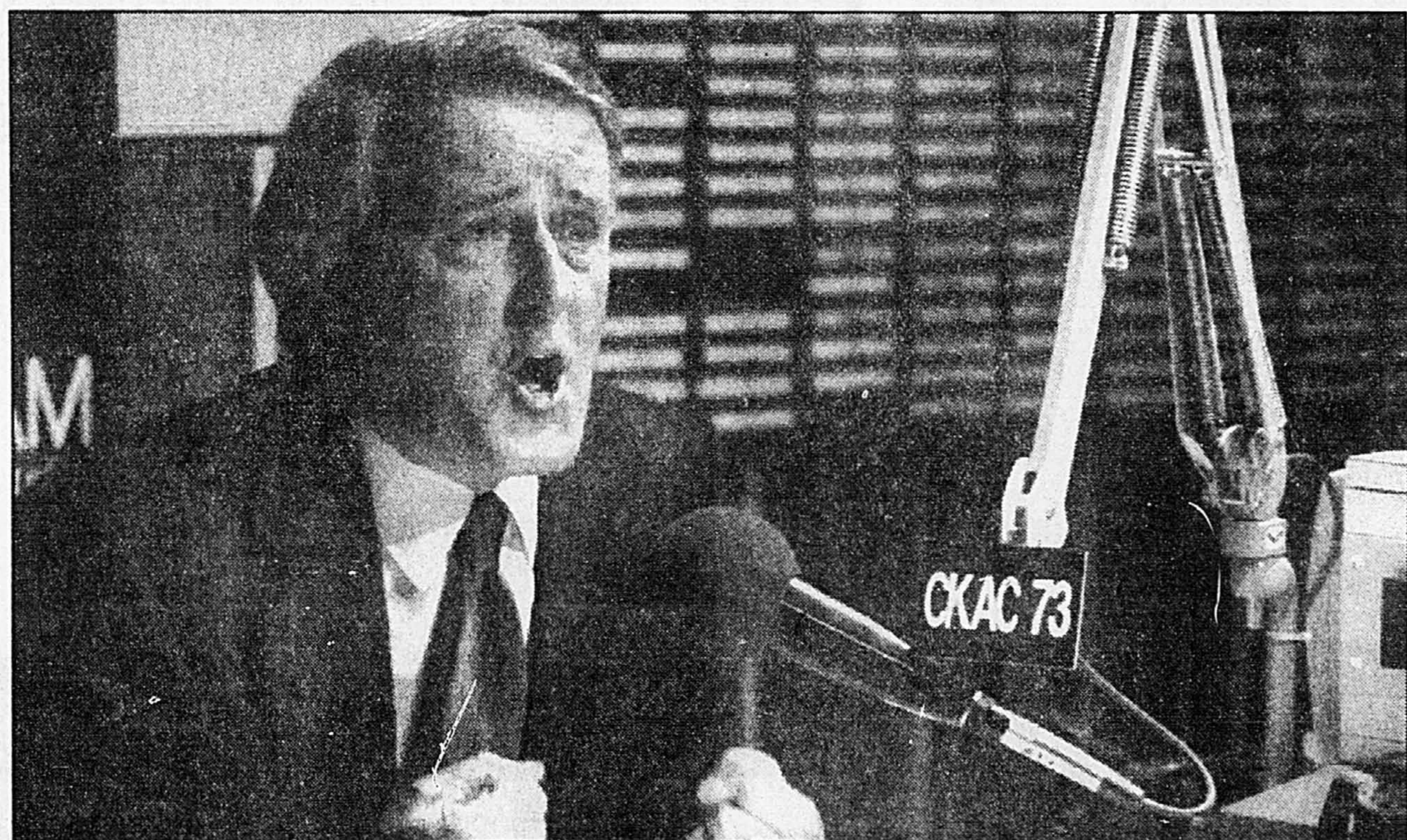
Le premier ministre Brian Mulroney a participé hier à une entrevue au réseau radiophonique Télémedia au cours de laquelle il a laissé entendre qu'Ottawa ferait des offres plus précises aux provinces que ne l'a fait le comité Beaudoin-Dobbie.

Ottawa assume 70 pour cent des paiements de compensation, qui atteindront 40 millions si tous les pêcheurs admissibles se font rembourser leur permis.