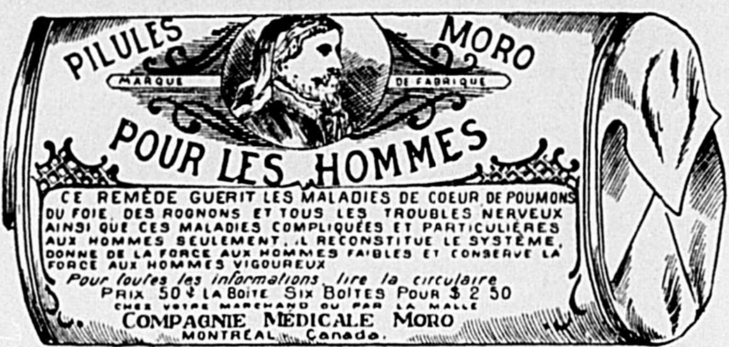
Fac-Simile exact d'une boîte de Pilules Moro.

Donnez-nous un homme brisé par les excès, la dissipation, un travail trop dur, les tracas, ou par toute autre cause qui ait sapé sa vitalité, avec les Pilules Moro nous le rendrons aussi vigoureux en tous points, que n'importe quel homme de son âge.