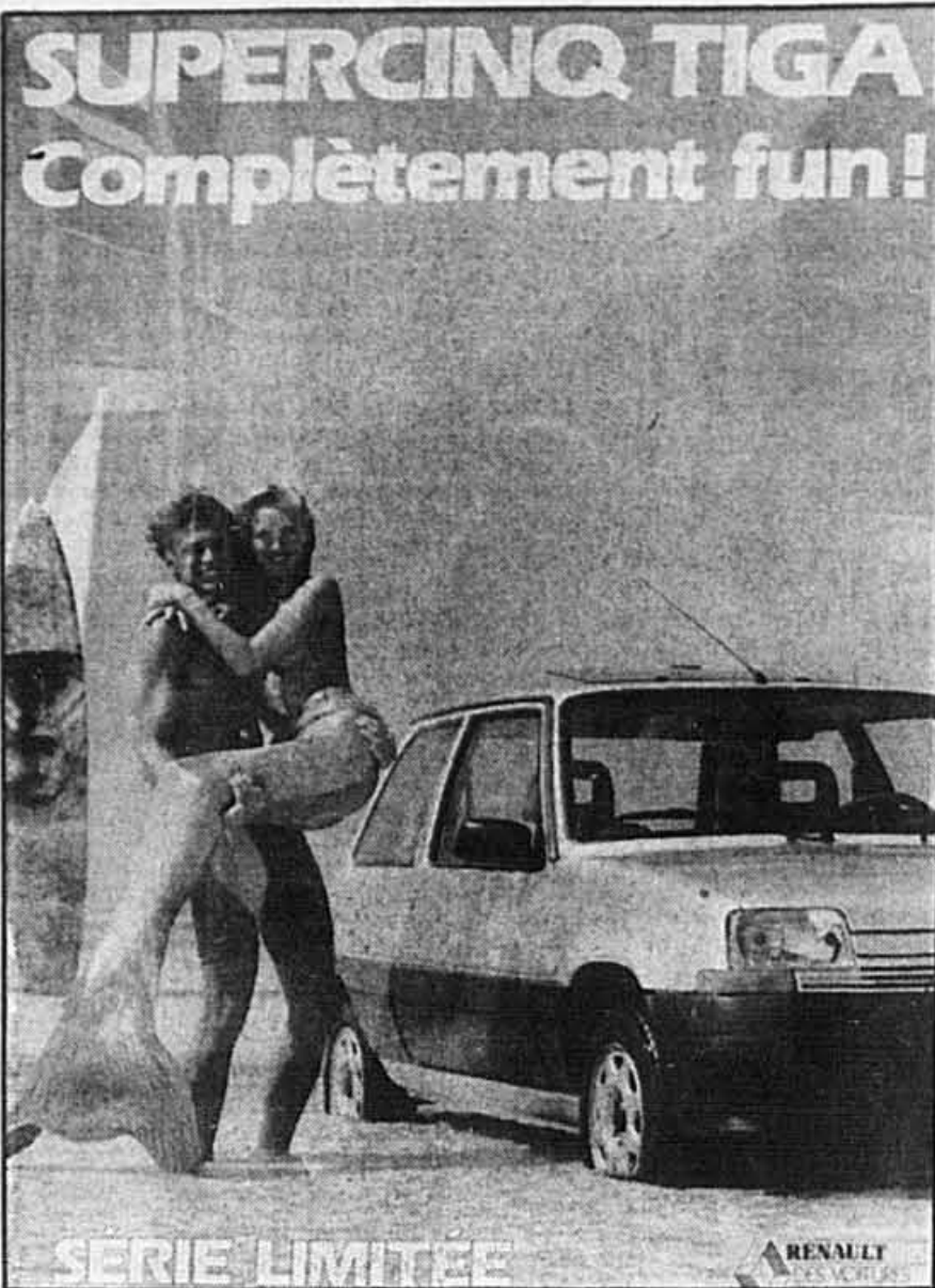
On aura remarqué que l'emploi du mot «fun», en France, n'est pas le même que celui que l'on en fait dans la langue courante au Québec. Assez bizarrement d'ailleurs, la formule utilisée par Renault est absolument intraduisible telle quelle en anglais.

Quel anglais au fait? L'anglais a effectivement le vent dans les voiles, en France en général, et à Paris à particulier. L'anglais? L'américain plutôt. Fini les contorsions labiales de haute voltige auxquelles, il y a 25 ans,