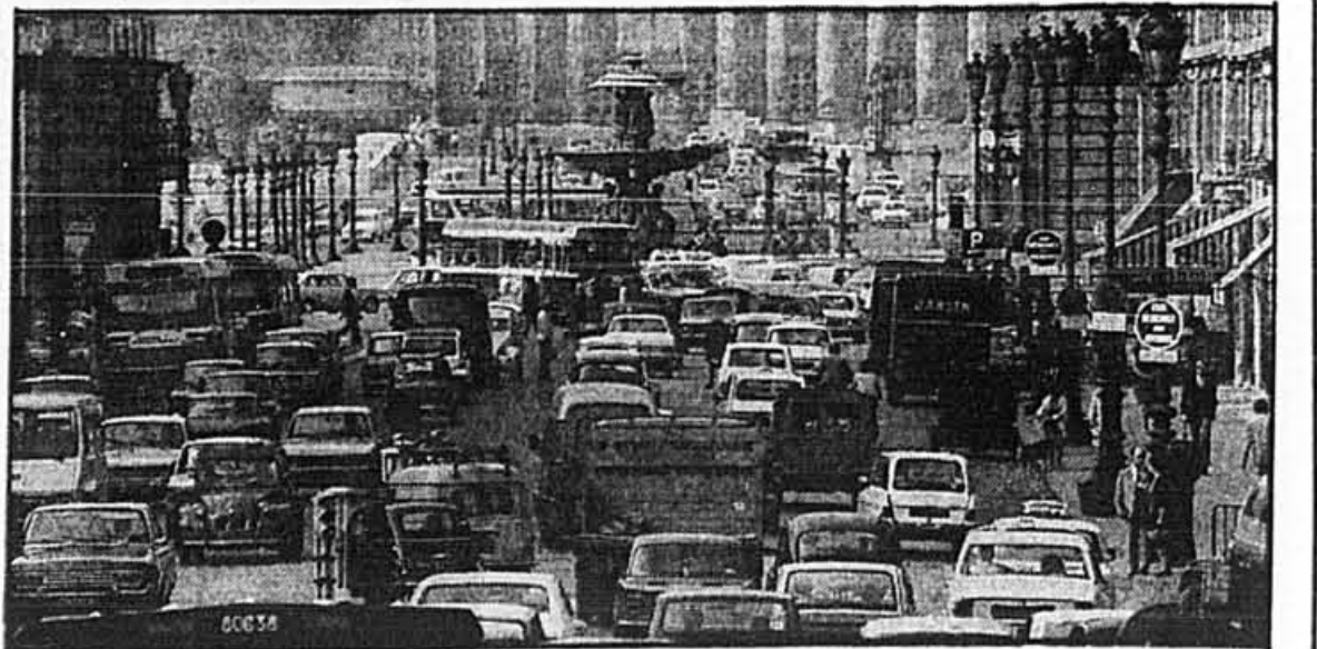
Pendant que les visiteurs sont aux anges, les Parisiens ralentissent.

Demain: 1789: la presse découvre sa liberté