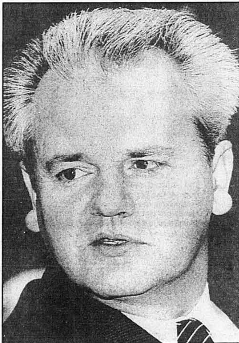
Slobodan Milosevic a prouvé dans la crise de la Serbie qu'il était un vrai leader.

Cependant, jusqu'ici le PC serbe ne s'est pas signalé par son ouverture à la démocratisation. Les élections à la présidence collégiale ont plutôt démontré le contrai-