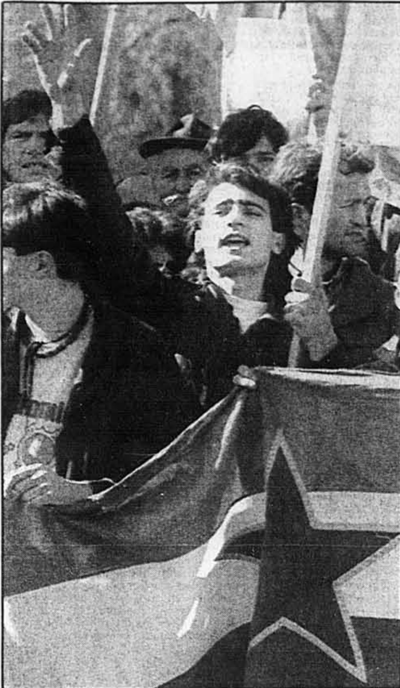
Un manifestant crie des slogans serbes devant le parlement de Belgrade.

Pour le prix actuel d'une miche de pain de 800 grammes, le consommateur pouvait acheter, il y a 18 mois, 5,4 kg de pain. Avec la somme nécessaire pour remplir modestement un panier de ménagère en avril, un Yougoslave pouvait vivre aisément neuf mois en octobre 1987. Depuis cette date, les produits alimentaires ont augmenté de plus de 800 p. cent, selon le quotidien Politika Ekspres , qui fait état en outre d'une baisse de 13 p. cent des ventes pour le seul mois de mars. Cette valse des étiquettes a même fait naître un