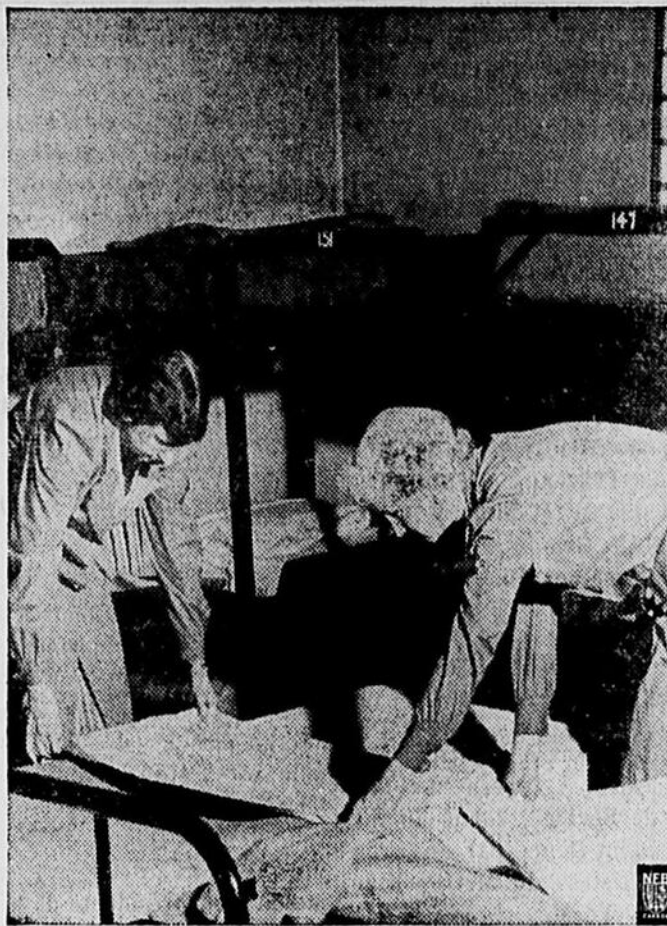
DES VOLONTAIRES A L'OEUVRE. — Dans plusieurs centres du Canada on a établi des hôtels à la disposition des soldats de nos forces armées qui sont en congé ou en mission. Cette réalisation nécessite la collaboration d'un grand nombre de volontaires. Nous en voyons ici deux à l'oeuvre en train de préparer de bons lits propres pour les arrivants. Toutes celles qui désirent consacrer leur loisir à cette tâche ou à d'autres du même genre pourront le faire en s'inscrivant auprès de leur comité local des Services Volontaires féminins ou en s'adressant directement au ministère des Services nationaux de guerre, à Ottawa.

—Tu as des traits réguliers mais tu n'as pas d'expression... Tu en prendras plus tard, lorsque tu seras heureuse de vivre et plus sûre de toi, me dit mon amie... Pourquoi se laisser aller? C'est plus qu'une exigence, c'est une faute. Pour ceux qui restent comme ceux qui reviennent, songe que tu dois montrer un visage qui reconforte. Pour cela, tu dois rechercher tout ce qui donne de la clarté, de la jeunesse, de la légèreté au visage. Envoie-moi promener cette poudre ocre qui te donne l'air d'avoir une crise de foie; adopte cette poudre légèrement rosée et, pour les joues, ce rose léger qui fait enfin remarquer que tu as une peau fine et fraîche. Pour les lèvres, un rouge franc et lumineux. Tu as des dents admirables et ce carmin très pur les mettra en valeur.