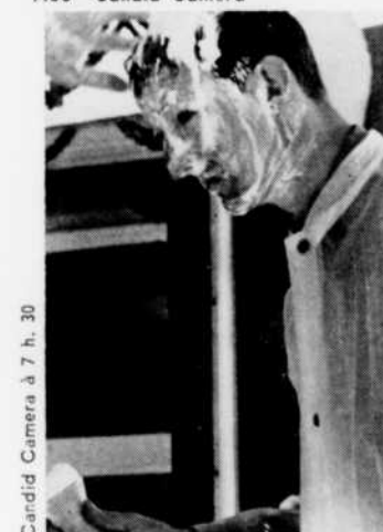
Candid Camera à 7 h. 30

7.25—CBMT—Ski Cast CBOT—Sports 7.30—Candid Camera