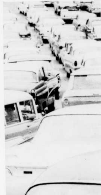
"L'assurance-automobile: pourquoi coûte-t-elle si cher?" est la question posée à "Cartes sur table", ce soir à 10 heures.