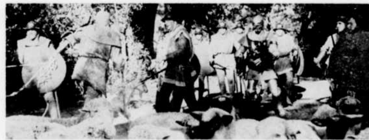
Le dimanche 3 janvier à 2 heures de l'après-midi, les aventures de "Ivanhoé", à la télévision.