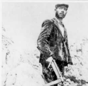
Le film à l'affiche à l'émission "Images en tête", à 4 h. 30, sera "Bandits à Orgosolo" de Vittorio de Seta.