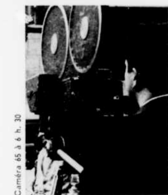
Caméra 65 à 6 h. 30

5.00—A l'heure du Concile L'Amérique latine. Le problème du logement au Chili. Témoignage du R.P. Josse Van Der Rest. 5.30—L'Heure des quilles 6.30—Caméra 65