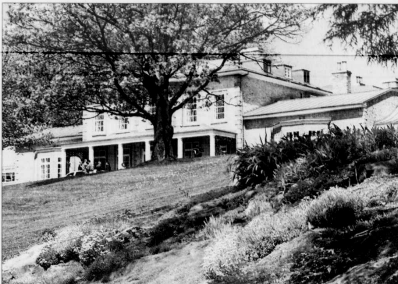
ARCHIVES LE SOLEIL

■ Si vous pensez déjà à vos vacances d'hiver et que les croisières vous intéressent, le voyageur Americanada vous propose un forfait particulièrement intéressant dans les Caraïbes : pour un tarif de base de 1489$, vous avez la possibilité d'effectuer une croisière de San Juan (Porto Rico) à St. Kitts en passant par St. Thomas/St. John, Tortola/Virgin Gorda, la Dominique, la Martinique et la Barbade, à bord du MS Holiday . Les départs ont lieu tous les samedis sur Air Transat à partir de Mirabel. Le forfait comprend non seulement le vol, mais aussi les taxes, les frais portuaires et les pourboires. De plus, les unilingues francophones n'ont aucune inquiétude à avoir puisqu'ils auront droit à un guide-accompagnateur parlant leur langue. Enfin, ceux et celles qui réserveront leur place avant le 30 septembre se verront accorder un crédit de bord de 250$ US par personne, les enfants compris. Pour plus de détails, contactez votre agent de voyages, qui doit avoir reçu la brochure Forfaits Croisière Caraïbes d'Americanada depuis le 30 juillet.