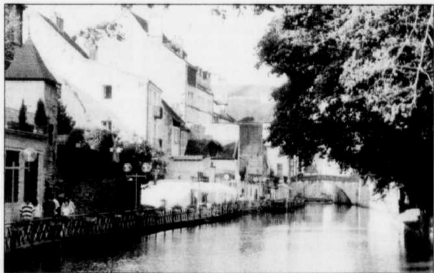
Vous pouvez vous arrêter où bon vous semble pour visiter, villes, villages, châteaux et caves à vins, en jetant l'ancre ou en amarrant votre bateau sur les berges qui sont publiques. L'amarrage au quai est gratuit.

■ SAINT-JEAN-DE-LOSNE — La « grosse vie sale » des vacanciers... j'ai compris ce que ça voulait dire en mai sur les canaux de Bourgogne à bord du bateau-péniche le Grand Classique . Mais avant de tenter la belle aventure de vacances en péniche, des amis m'en avaient chaudement parlé. Maintenant, je peux l'affirmer: tout ce qu'ils ont dit était vrai. C'est effectivement le summum pour qui veut oublier en moins de deux les tracas du bureau, les corvées de la maison et même ces grands ados qui ont promis d'être sages comme des images... en votre absence.