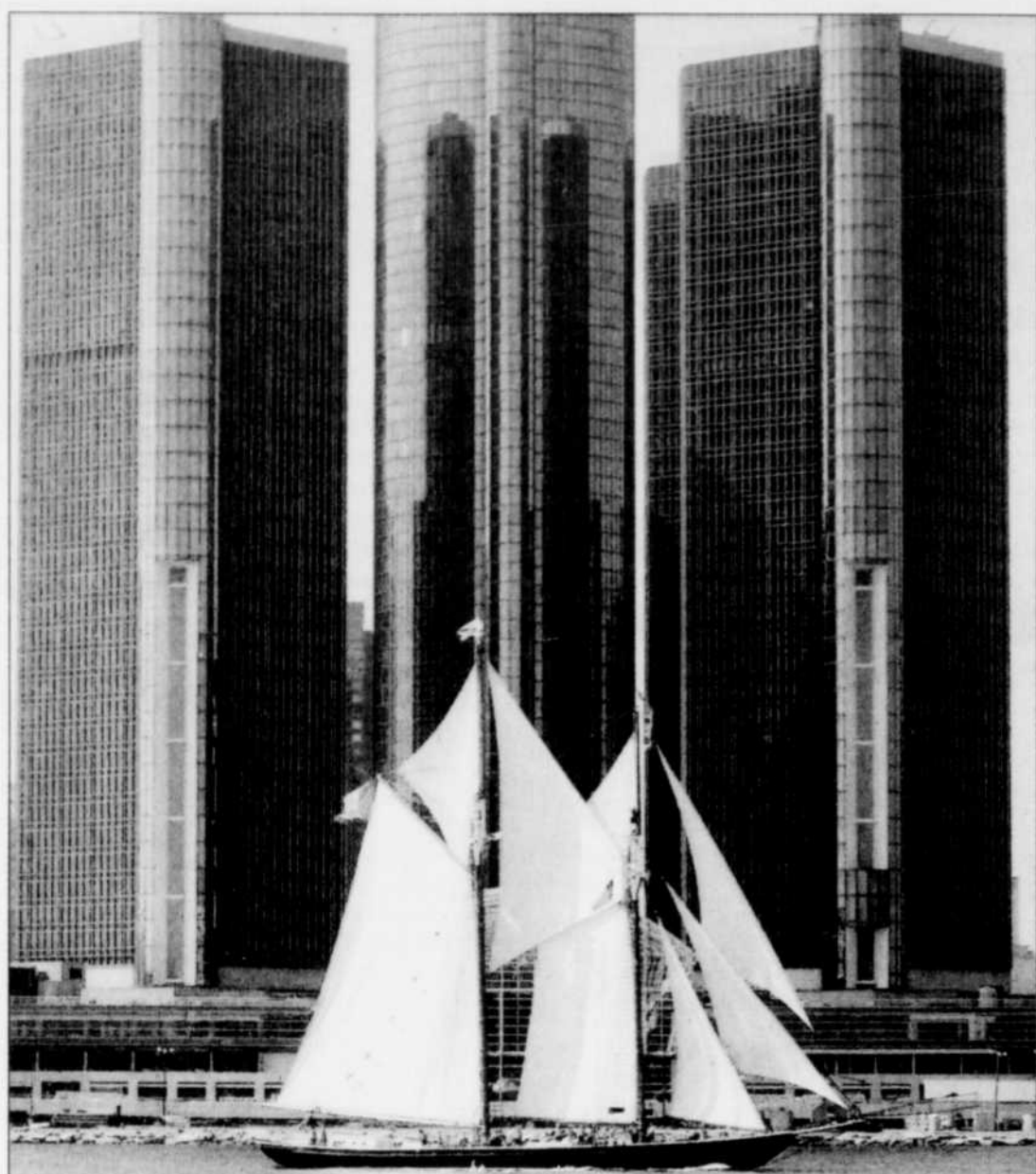
Les guides touristiques décrivent la capitale mondiale de l'automobile « comme dangereuse, grise, où la rouille fait peine à voir »

n'a plus qu'un million d'habitants. Selon le dernier recensement, Detroit compte 82 % de Noirs et la plus importante communauté musulmane des États-Unis.