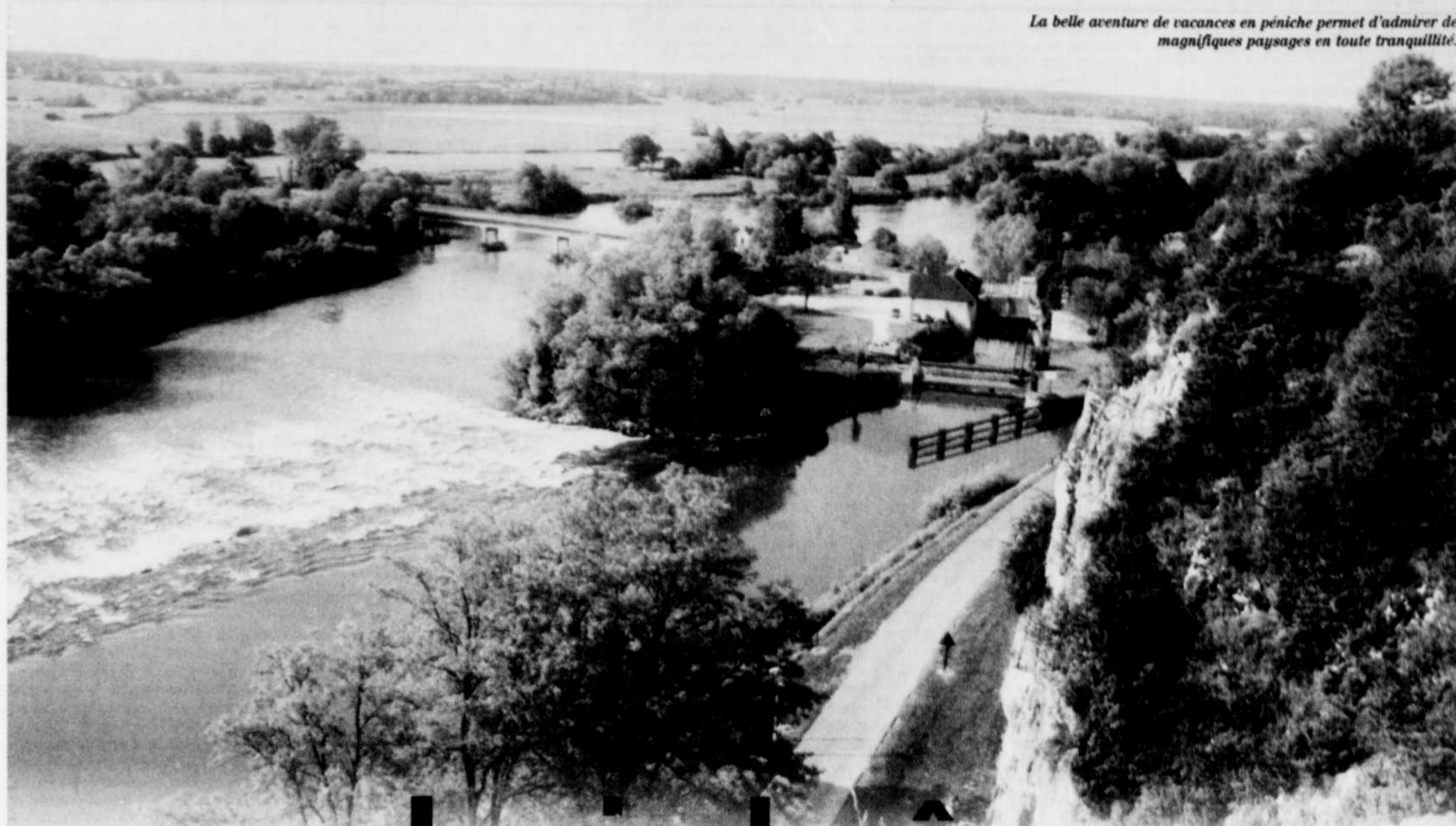
La belle aventure de vacances en péniche permet d'admirer de magnifiques paysages en toute tranquillité.