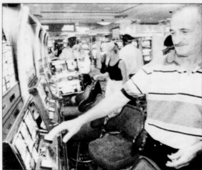
Trois casinos sont en construction à Detroit.

Mais l'espoir subsiste. Patrons d'entreprises et urbanistes s'accordent à dire qu'en ville une régénération est en marche, notamment avec la construction de trois casinos, d'une poignée de projets immobiliers et de deux nouveaux stades de football et de baseball.