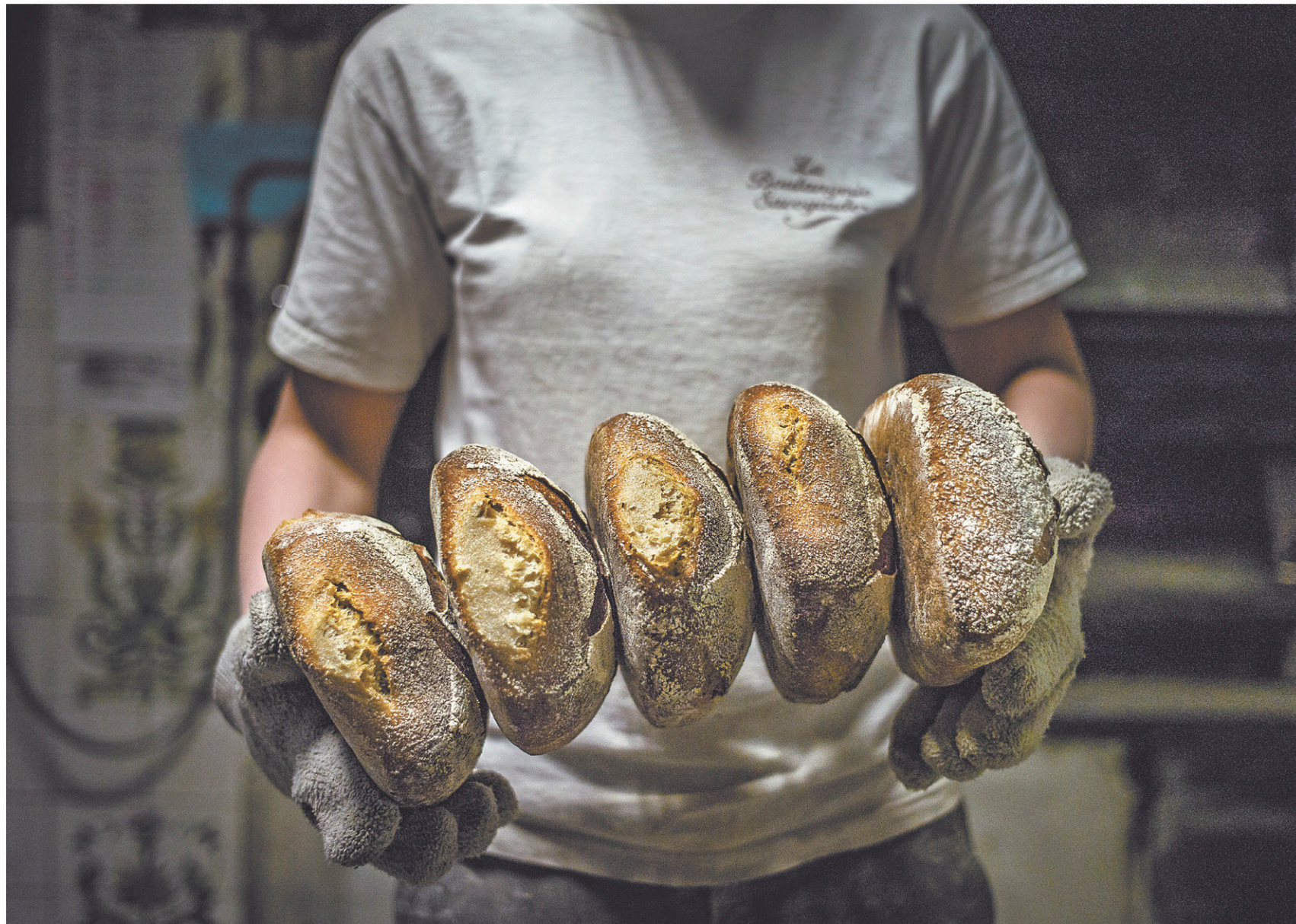
Des boulangers utilisent des blés « d'exception », comme le khorasan. Il s'agit de variétés « paysannes » qui avaient été abandonnées après la guerre pour pallier les insuffisances de la production céréalière, l'agriculture privilégiant le rendement.