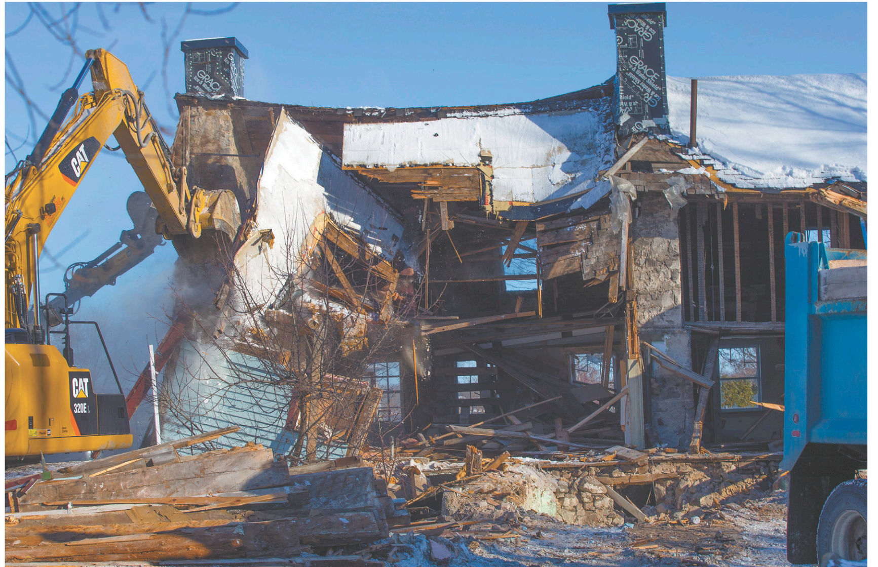
Destruction de la maison Boileau, à Chambly. Les événements de cet automne ont véritablement favorisé une prise de conscience populaire. De plus en plus, l'idée que le patrimoine est une ressource collective qui doit être protégée a fait, pour le mieux, son chemin dans les esprits.

Il faut rappeler que la protection du patrimoine est d'abord et avant tout une question de culture. Tous les peuples du monde, d'une manière ou d'une autre, cherchent à mettre en valeur les traces particulières de leur évolution