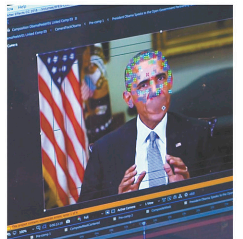
Une fausse vidéo faisant parler Barack Obama a circulé en 2018.