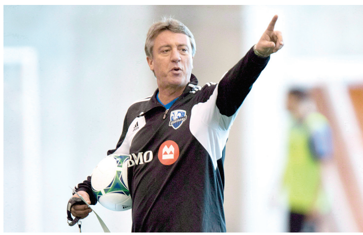
PAUL CHIASSON LA PRESSE CANADIENNE

L'Impact disputera son premier match sur gazon naturel cette saison contre le Sporting