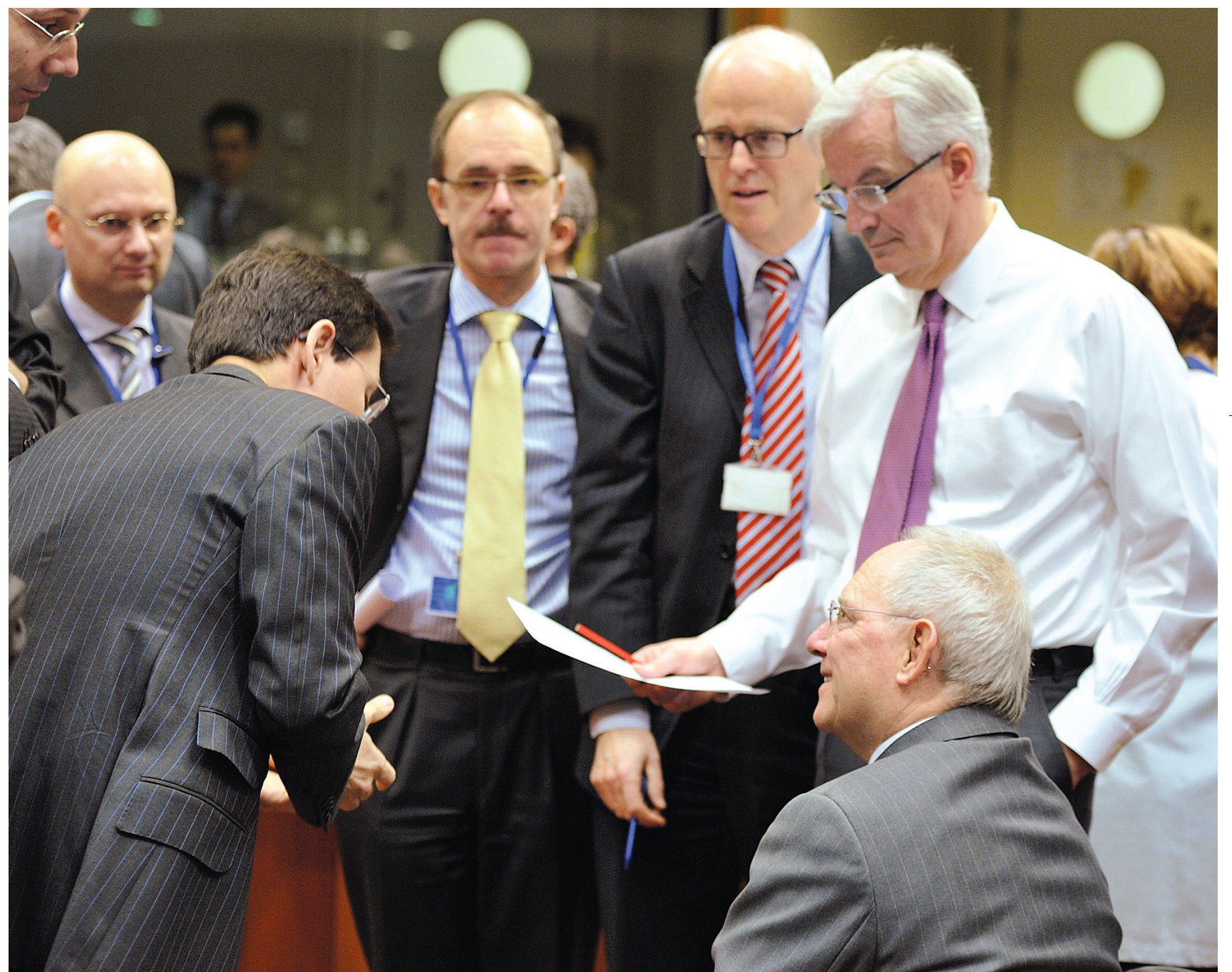
Réunion des ministres des Finances de la zone euro à Bruxelles, le 5 mars. Le ministre allemand des Finances, Wolfgang Schäuble (assis), et le commissaire européen au Marché intérieur et aux Services, Michel Barnier (à droite), discutant avec des conseillers.

La mécanique s'est alors inversée, transformant les Allemands en inconditionnels de l'intégration. M me Merkel a conditionné le sauvetage de la Grèce, puis de l'Irlande, du Portugal et