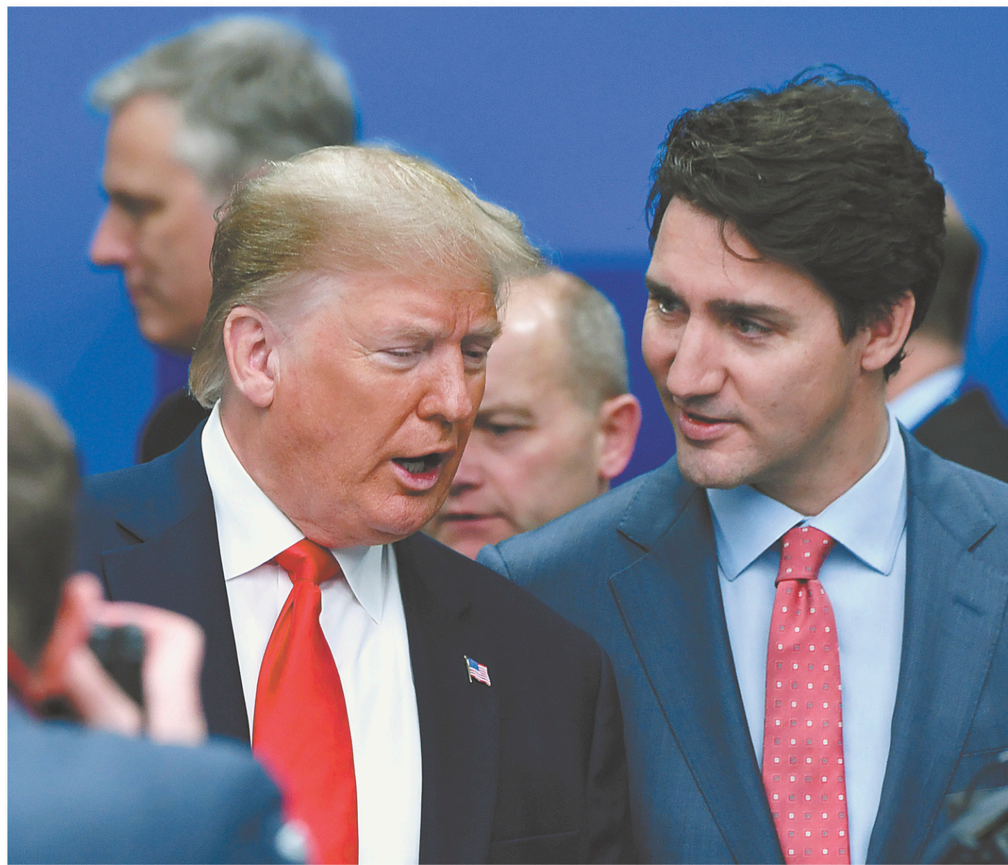
Mercredi, Justin Trudeau s'est approché de Donald Trump, apparemment pour s'expliquer sur la vidéo de la veille, mais le président des États-Unis n'a pas paru souhaiter prolonger l'échange avec le premier ministre canadien.