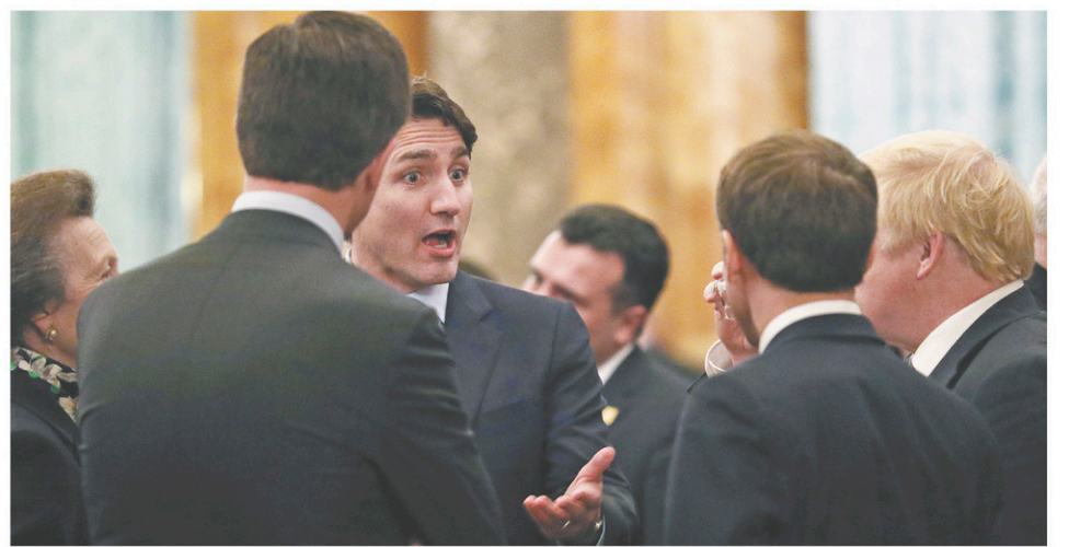
Justin Trudeau a discuté, de manière visiblement amusée, avec Emmanuel Macron et Boris Johnson mardi soir au palais de Buckingham, lors d'une réception des chefs d'État.