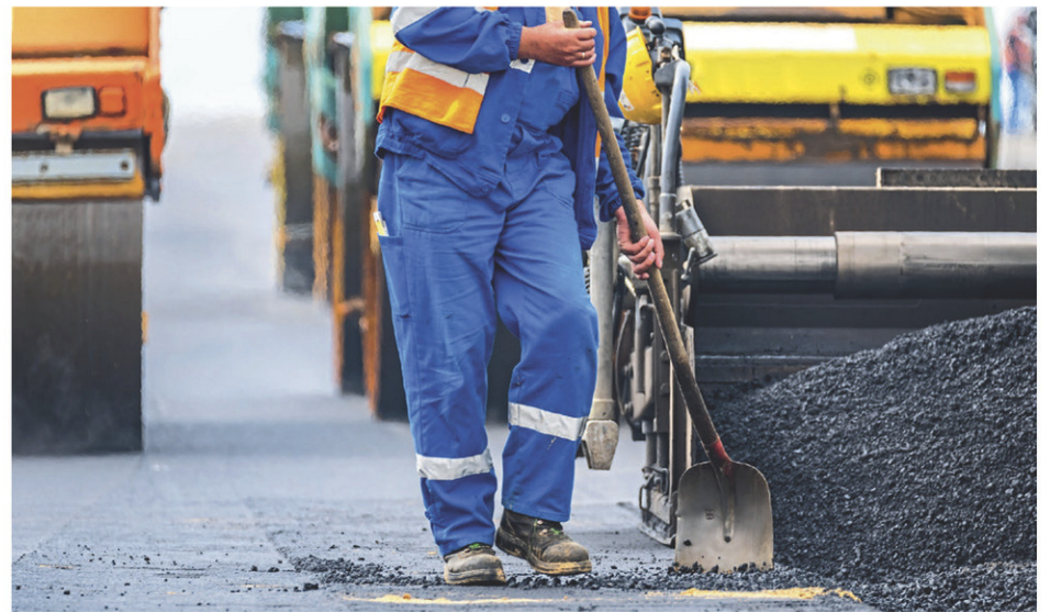
Quelque 70 projets de réfection, de sécurisation et de construction sont prévus à travers le Centre-du-Québec d'ici les deux prochaines années.

D'autres structures subiront des interventions de réparation (pont situé sur la route 132, au-dessus de la rivière Marguerite, à Bécancour), et de réfection (pont Trahan-Savoie situé sur le chemin du Petit-Chenal, au-dessus de la rivière