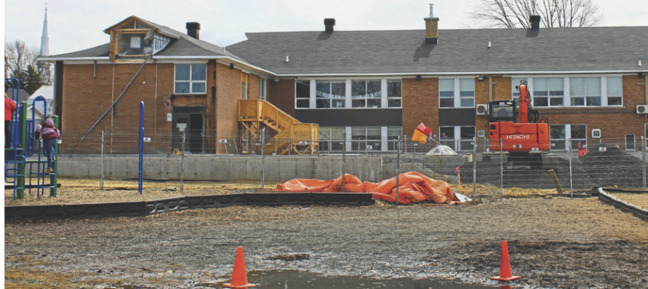
Le chantier de l'agrandissement de l'école Tournesol de Saint-Léonard-d'Aston.

bas soumissionnaire conforme. La réalisation des travaux a été confiée à l'entreprise CR Nouvel-Air 2018 inc. de Saint-Léonard-d'Aston, pour une