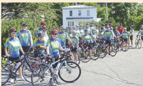
Des cyclistes du club Vélozone de Nicolet.

Encore cette saison, le Club tiendra la majorité de ses randonnées le mercredi matin.