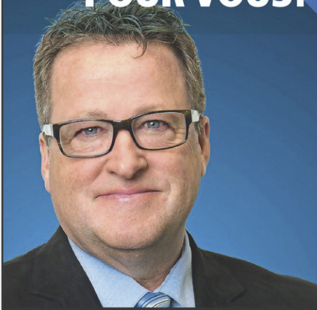
DONALD MARTEL Député de Nicolet-Bécancour