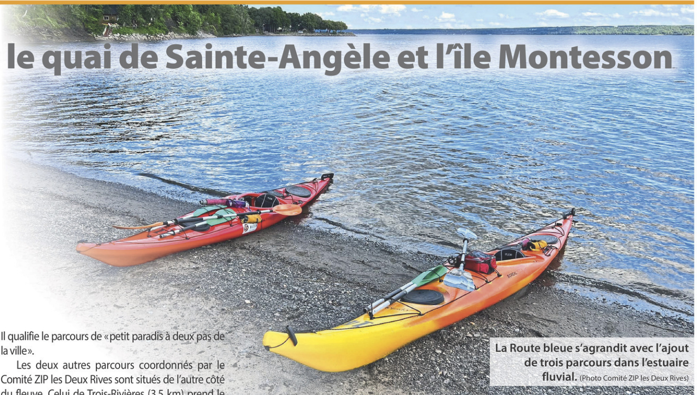
La Route bleue s'agrandit avec l'ajout de trois parcours dans l'estuaire fluvial.

Rappelons que la Route bleue est déployée partout en province. Elle propose aux amateurs de sports de pagaie un vaste réseau de parcours sécuritaires et facilement accessibles.