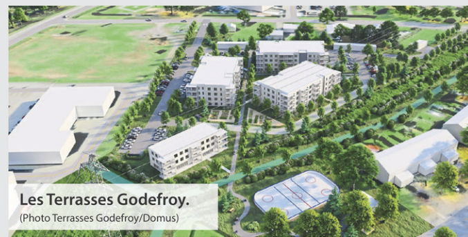
Les Terrasses Godefroy.

Cette période de report permettra à la Ville d'aborder, en concertation avec les citoyens, les éléments qui la concernent avant de prévoir la suite du projet. «On espère arriver à un produit final qui répondra à l'ensemble, ou presque, des préoccupations», signale la mairesse Lucie Allard.