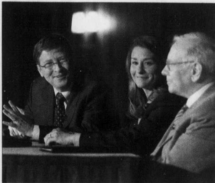
Warren Buffett (à droite) a rencontré hier le couple Bill et Melinda Gates, au cours d'une réunion-débat à la grande bibliothèque de New York.

Investisseur à la tête d'une holding diversifiée, Buffett, 75 ans, surnommé «l'oracle d'Omaha», du nom de sa ville d'origine, avait toujours dit que ses enfants devaient hériter de suffisamment de moyens mais