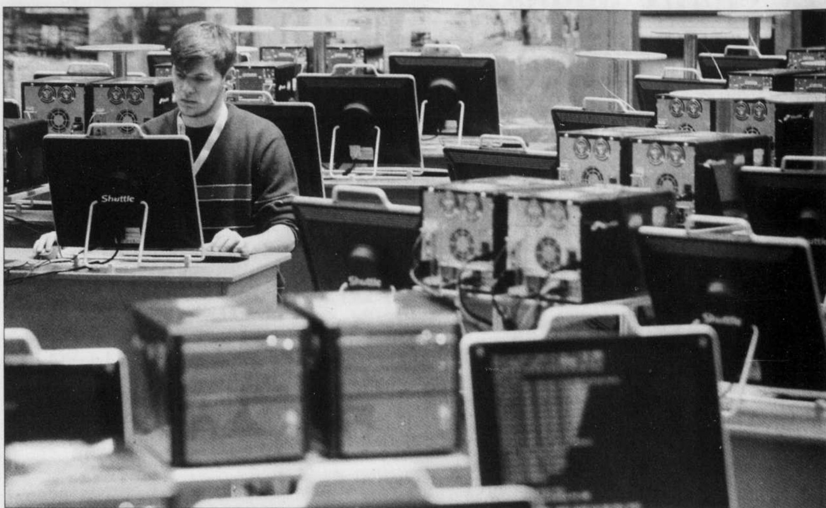
Les docks de Dublin vivent une véritable métamorphose avec la construction d'hôtels et de bureaux. Différentes nationalités s'y côtoient, occupant un large éventail d'emplois, de la restauration rapide à l'informatique.

Devant toutes ces propositions de changement, visant à guérir l'OMC des maux qui l'accablent, on se dit qu'il reste encore au moins une option qui n'a pas été envisagée. C'est que l'impasse des négociations du cycle de Doha est due à des divergences d'intérêts fondamentales entre les principaux acteurs en présence. Des divergences que même la meilleure organisation qui soit et les meilleurs processus de conciliation qui soient ne pourraient pas régler. Du moins tant et aussi longtemps que les gouvernements souverains qui les incarnent n'auront pas la volonté, ou la capacité, d'accepter de faire des concessions parce qu'ils seraient convaincus d'obtenir en échange un plus grand bien.