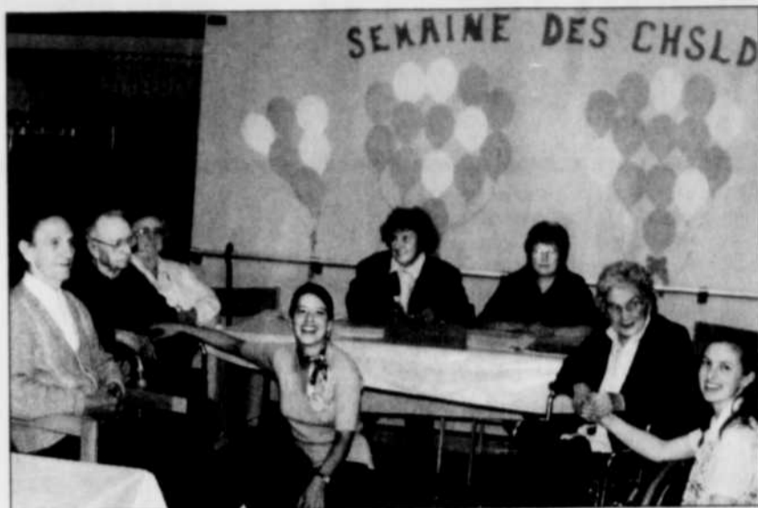
COLLABORATION SPÉCIALE ANDRÉ BÉCU

Des représentants du Groupe Axor et du gouvernement du Québec doivent annoncer, vraisemblablement demain, le début des travaux de construction d'un premier parc éolien à Cap-Chat. D'ici les prochains mois, quelque 75 éoliennes à axe horizontal seront installées à l'ouest de cette localité gaspésienne. Puis, en 1999, une soixantaine d'autres seront érigées dans la région de Matane. Le projet « Le Nordais » regroupe divers partenaires dont le fabricant d'éoliennes Micon et le consortium japonais Nichimen. Le projet global est évalué à 160 millions $. H.M.