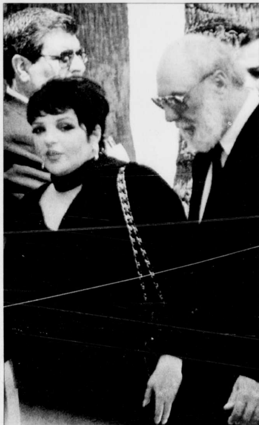
Liza Minnelli et un homme nonidentifié font leur entrée dans la petite chapelle où étaient célébrées les funérailles de Frank Sinatra. Détails en page C 11.