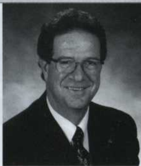
Rémy Trudel Député de Rouyn-Noranda/ Témiscamingue