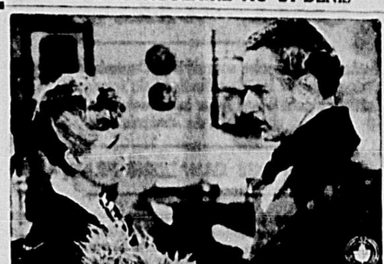
Michèle Alfa et Pierre Richard-Willm dans le film "LE CHATIMENT" 2e époque de la production spectaculaire "Le Comte de Monte Cristo", aujourd'hui à l'écran du St-Denis.