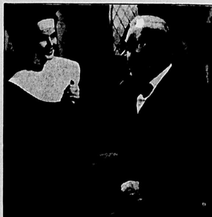
Soeur Benedict vient juste d'apprendre que le pire ennemi de son école (Henry Travers) a répondu à ses douces prières. Ingrid Bergman partage la vedette avec Bing Crosby dans le film de Leo McCarey "THE BELLS OF ST. MARY'S" qui reste à l'affiche pour une deuxième semaine au Loew's.