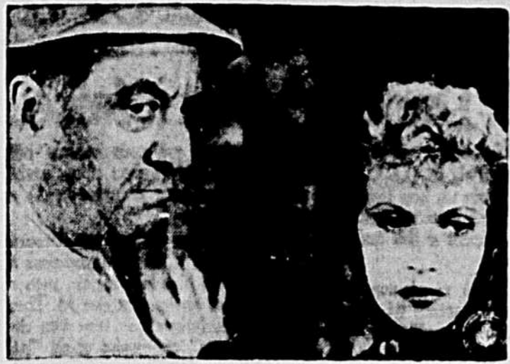
Le génial artiste Raimu et la sympathique Josette Day dans le film de Pagnol, 'LA FILLE DU PUISATIER', gardé à l'affiche du Cinéma de Paris, une 3e semaine.