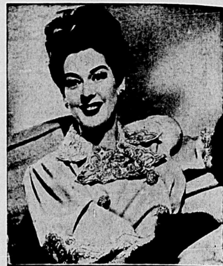
Rosalind Russell, en vedette dans le film "SHE WOULDN'T SAY YES", qui passe à l'écran du Capitol.

A Winnipeg tous les printemps, se déroule le Festival de Musique du Manitoba — 14,000 enfants, garçons et fillettes, prennent part à ce déploiement artistique. L'Office du Film se fait l'écho de ce festival dans le documentaire: "Une Ville Chante", série En Avant Canada.