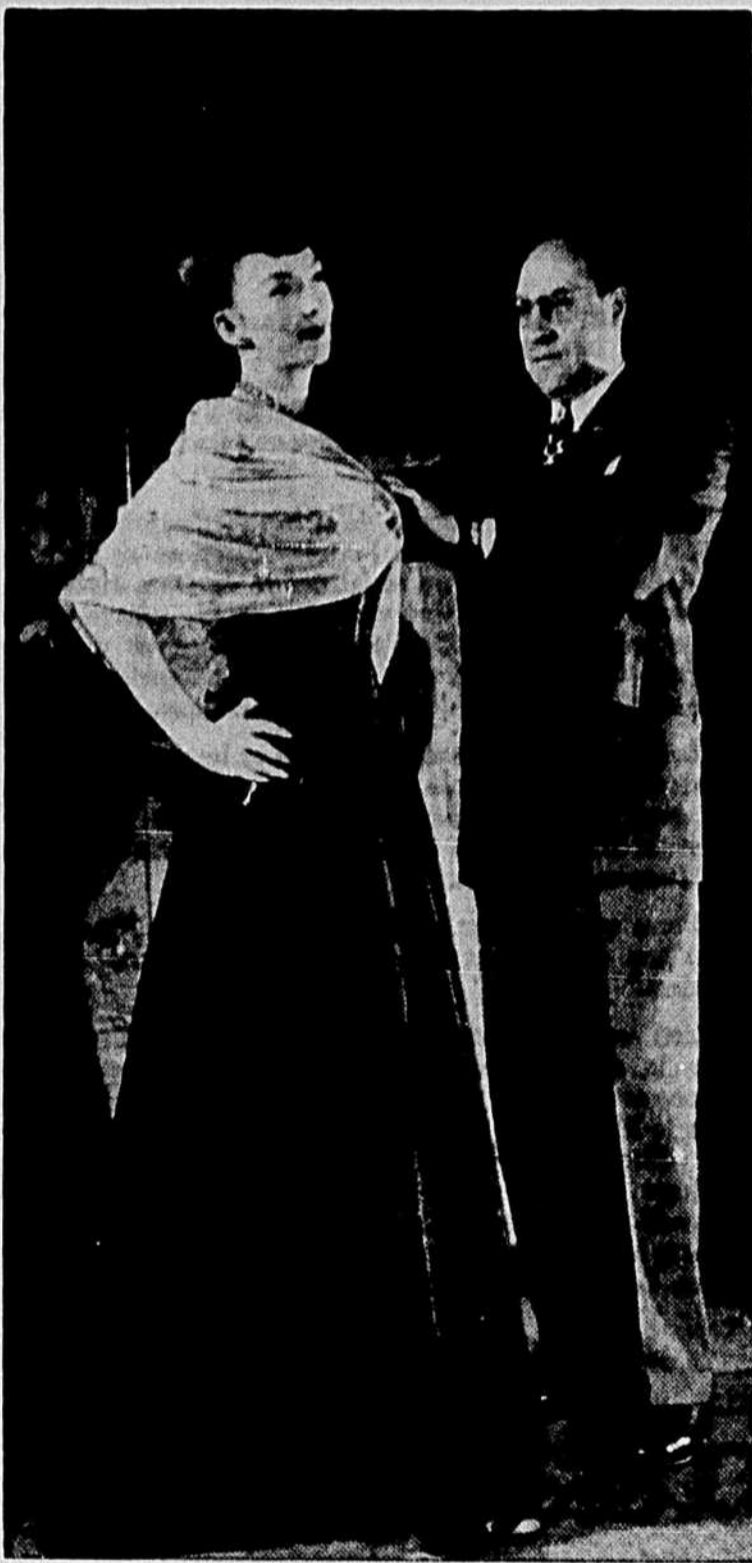
Cette robe de nylon à laquelle on est en train de donner une dernière "touche" a été imaginée et réalisée à Montréal dans les studios Sperber, spécialement pour le documentaire "Création Canadienne", de l'Office National du Film, série "En Avant Canada".