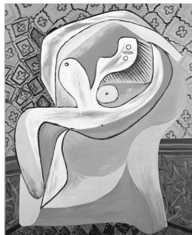
Le Repos, 1932.

et 350 tableaux et quelques milliers de dessins, le tout couronné par le château de Boisgeloup.