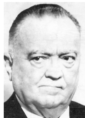
J. Edgar Hoover