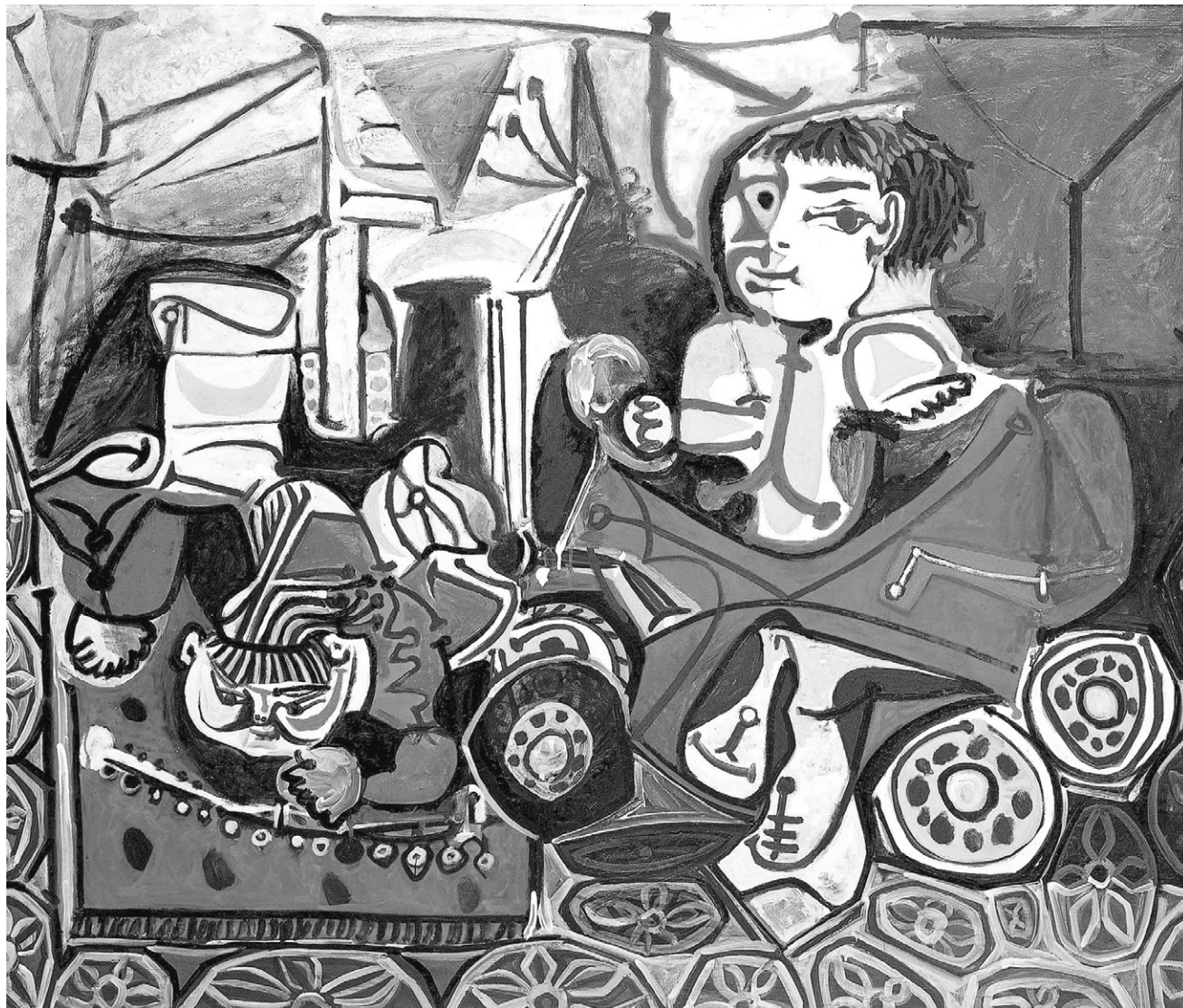
Les Jeux, 1950