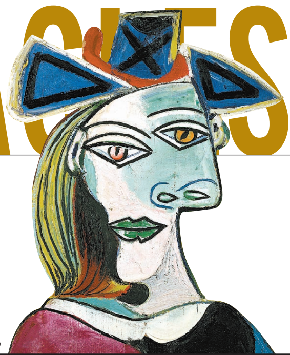
Tête de femme au chapeau bleu à ruban rouge, 1939

CAHIER C | LA PRESSE | MONTRÉAL | MARDI 26 SEPTEMBRE 2000