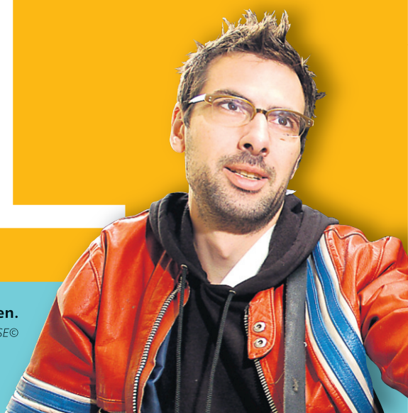
Champion, DJ et musicien.