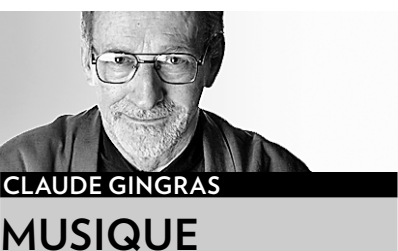
CLAUDE GINGRAS MUSIQUE

Le cinquième et avant-dernier concert de la série «Mozart Plus» de l'Orchestre Symphonique de Montréal, demain soir, 19h30, à la basilique Notre-Dame, est aussi le troisième et dernier de la «phase 3» de l'intégrale des Concertos pour piano de Mozart entreprise en 2003 par Louis Lortie comme soliste et chef dirigeant du piano.