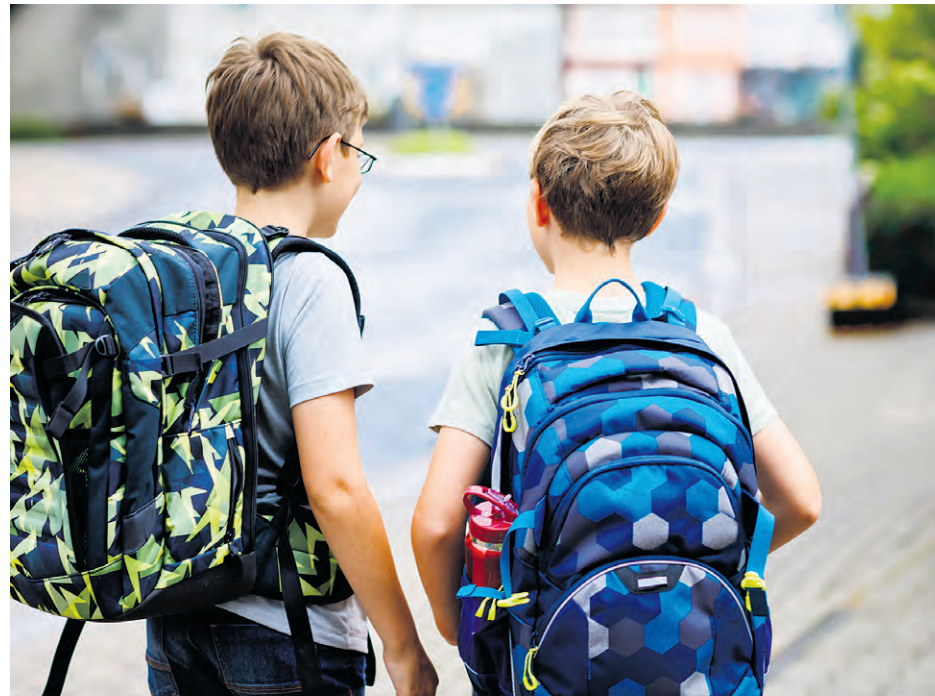
Un sac à ceinture abdominale est recommandé

Répartir le poids correctement : Placez les objets lourds près du dos de l'enfant et évitez d'accrocher des objets supplémentaires au sac à dos.