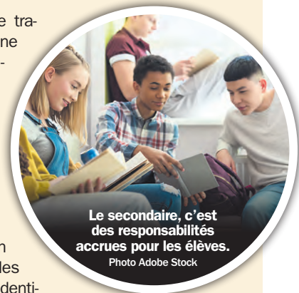
Le secondaire, c'est des responsabilités accrues pour les élèves.

Les parents peuvent soutenir leurs enfants en partageant leurs propres méthodes d'organisation et en les aidant à comprendre l'importance d'une bonne gestion du temps. Les parents peuvent également encourager les élèves à utiliser des ressources comme Alloprof pour identifier et travailler sur les matières problématiques.