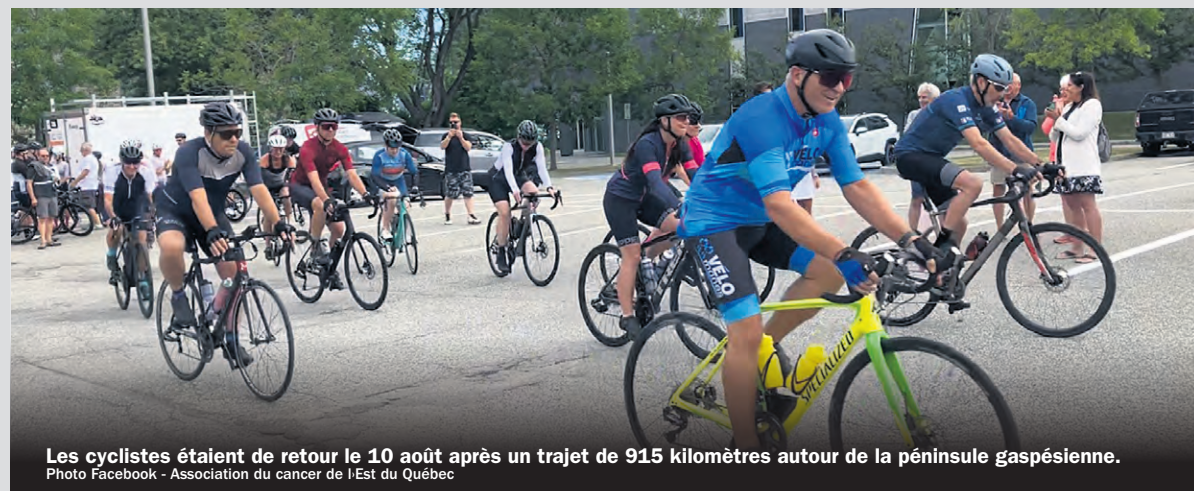
Les cyclistes étaient de retour le 10 août après un trajet de 915 kilomètres autour de la péninsule gaspésienne.