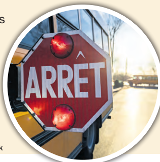
Rentrée scolaire rime avec retour des autobus sur la route.

Pour plus d'informations, consultez le site de la Société de l'assurance automobile du Québec (SAAQ).