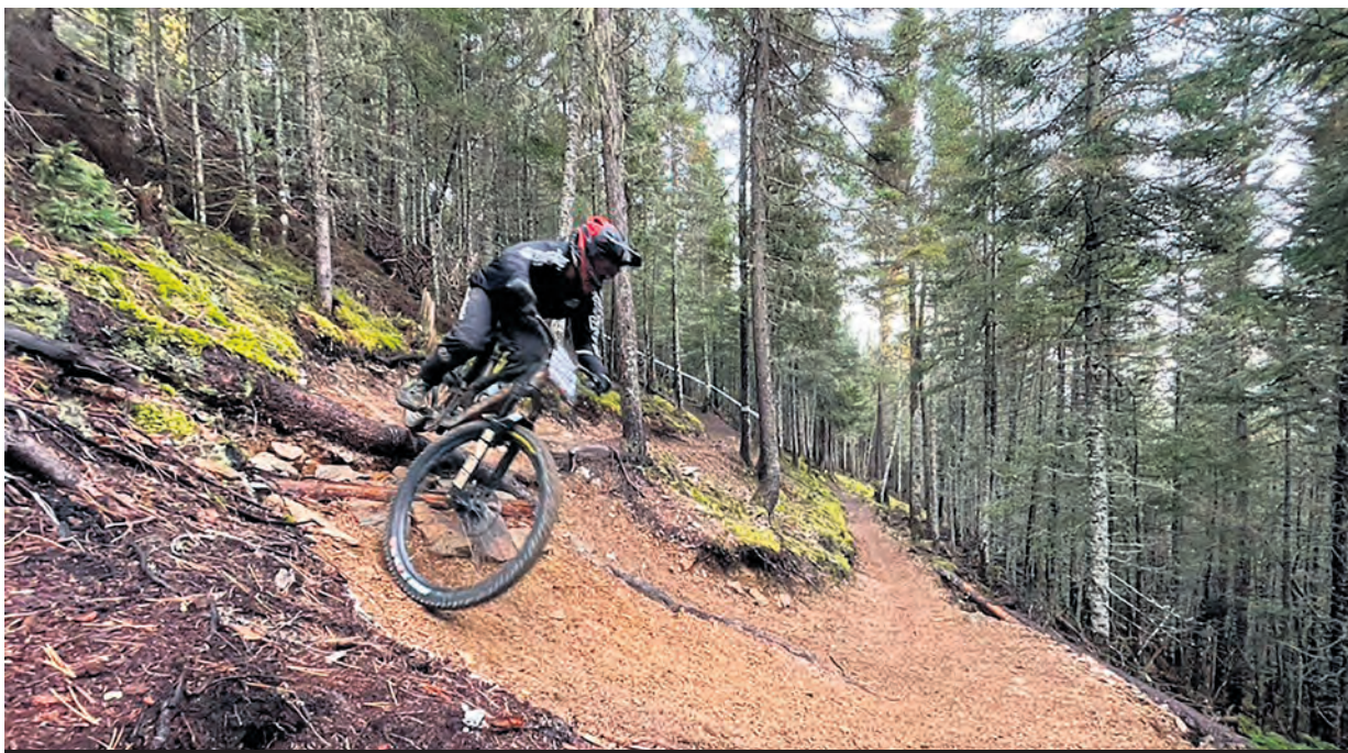
Le samedi sera réservé aux étapes 5 et 6 du Circuit Desjardins de vélo de montagne de l'Est-du-Québec, alors que le dimanche, ce sera au tour de la deuxième étape de la toute nouvelle Série Enduro Gaspesia.

Le lendemain, dimanche, ce sera au tour de la deuxième étape de la toute nouvelle Série Enduro Gaspesia, qui se tiendra dans les Sentiers du Bout du Monde. La première étape a eu lieu au Mont-Comi en juin; la troisième et ultime se tiendra à la station touristique Pin-rouge, le 13 octobre. Rappelons que les épreuves d'enduro se déroulent sur des parcours pouvant durer entre 90 minutes et 3 heures. Seulement les portions de descente sont chronométrées; les participants doivent compléter les portions de montées en un temps maximum. Les parcours seront adaptés au contexte régional de naissance de la discipline, par le degré de difficulté technique des sentiers, le kilométrage et le