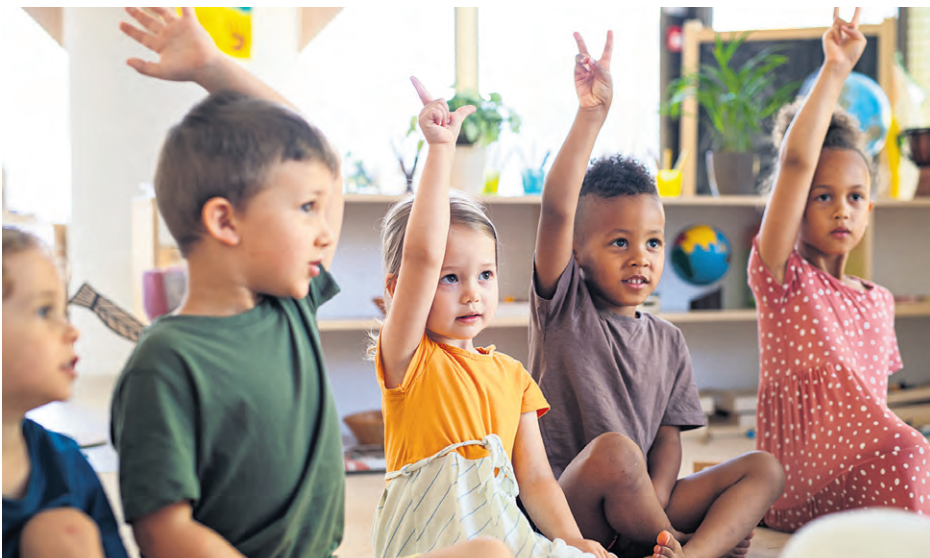
Le passage à la maternelle est une grande étape pour les enfants.