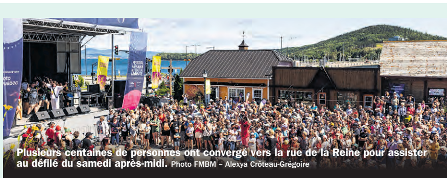
Plusieurs centaines de personnes ont convergé vers la rue de la Reine pour assister au défilé du samedi après-midi.

«Avec ces trois artistes de différentes générations, généreuses et proches du public, nous sommes assurés de remplir notre mission de faire rayonner le cinéma d'auteur, autant re-