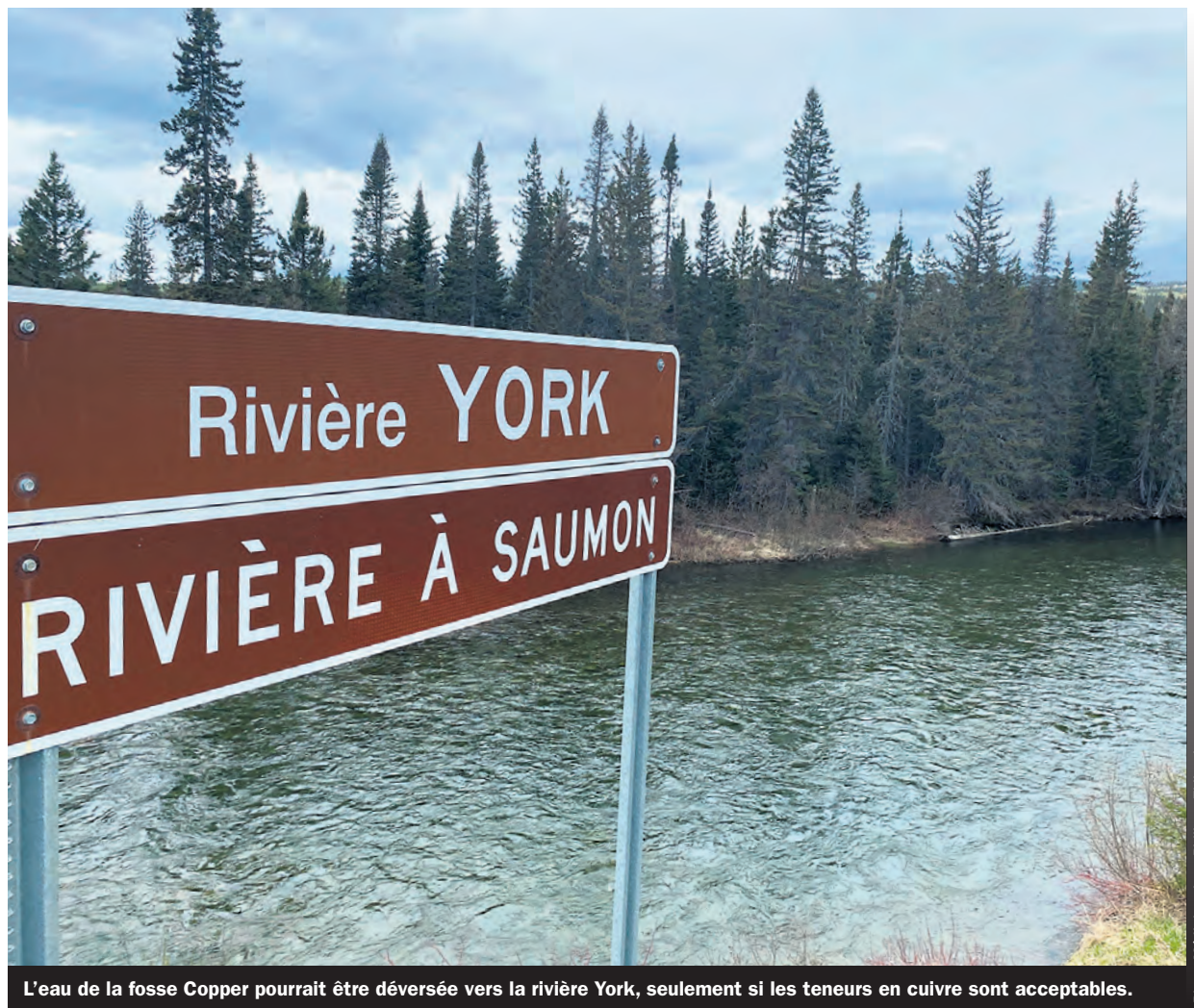
L'eau de la fosse Copper pourrait être déversée vers la rivière York, seulement si les teneurs en cuivre sont acceptables.

Le Conseil de l'eau du nord de la Gaspésie évalue que la dureté de l'eau de la fosse Copper pourrait être comprise entre 100 et 200. Selon les données du ministère, le critère de qualité pour la protection de la vie aquatique pourrait donc se situer entre 9,3 et 17 microgrammes de cuivre par litre, maximale. C'est en deçà des 65 à 70 microgrammes calculés jusqu'à présent. « C'est très peu,