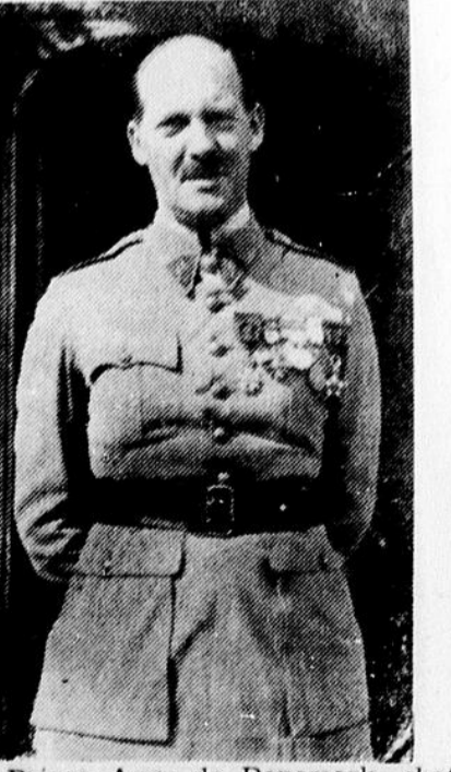
Le Prince Aage de Danemark, chef de bataillon à la Légion Etrangère, est mort à Taz (Maroc) à la suite d'une courte maladie. Le Prince Aage de Danemark, allié de toutes les grandes familles royales d'Europe, petit-fils du Duc de Chartres était âgé de 50 ans. Il était à la Légion depuis 18 ans. Une récente photo du Prince en tenue de Commandant de la Légion. Censure no 39094.