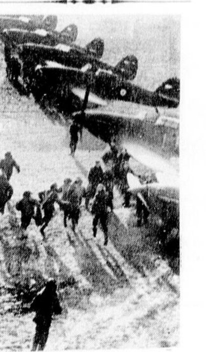
Alerte sur un Aérodrôme. On voit ici sur un aérodrôme britannique quelque part en France, des pilotes de la Royal Air Force, courant vers leurs appareils des avions ennemis sont signalés. Censure no. A. 4390.

Dans le compte rendu de la conférence du directeur de ce journal, le typo nous faisait dire que le détournement de 3500 pieds cubes d'eau à la seconde fait à Chicopee, baissait le port de Montréal de 4.5 pieds. C'est 4.4 pouces qu'il aurait fallu dire.