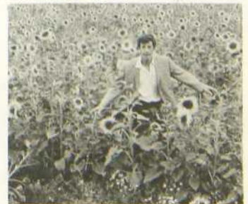
L'Homme de Rio

Suit une série d'aventures rocambolesques qui mène le pauvre Adrien de Paris à Rio, voyage qu'il n'avait évidemment pas prévu. Le scénario rappelle par bien des points les Tintin les plus célèbres: la manière dont il est traité aussi et dans le meilleur sens. Le rythme trépidant se maintient de bout en bout, sans jamais fatiguer. Le rire jaillit spontanément des situations, des reparties d'Adrien ou des réactions d'Agnès. Ce film sans défaillance, plein de dynamisme et d'humour, distrait le plus large public.