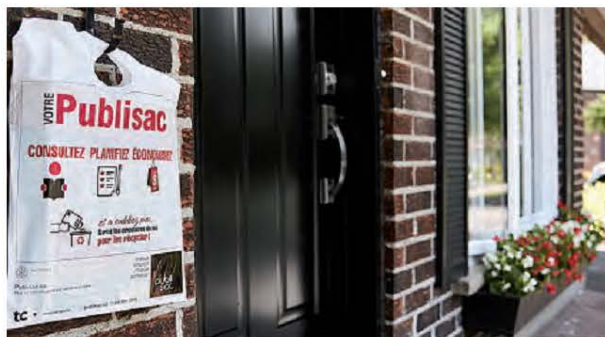
Face à la pandémie de COVID-19, Publisac suit rigoureusement les recommandations gouvernementales.

- Nous avons revu les méthodes de distribution afin de limiter le nombre de contacts possible. Nous sommes en com-