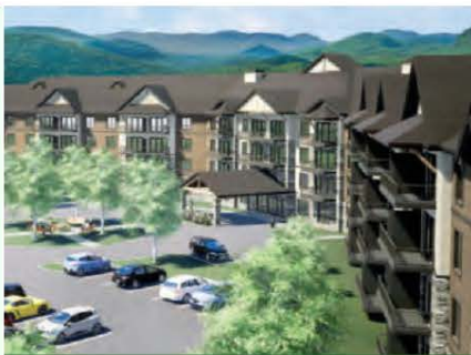
Le Sanctuaire du Mont-Tremblant, une merveilleuse alternative aux résidences pour aînés.