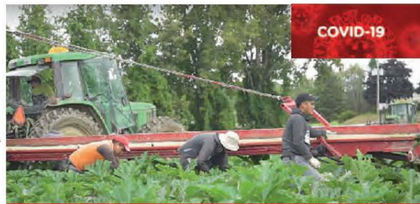
Chez Vegibec, à Oka, plus de 200 travailleurs étrangers sont embauchés chaque année.