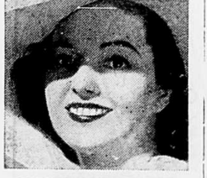
"SANS LE MOINDRE DOUTE"

Oui, c'est sans le moindre doute que la Pâte Dentifrice Macleans nettoie les dents à fond, les rend d'une blancheur éclatante, neutralise l'acidité de la bouche, garde les gencives fermes et saines, laisse une haleine agréable.