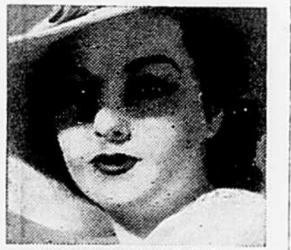
Avez-vous employé de la Pâte Dentifrice MACLEANS aujourd'hui?

La famille a reçu de très nombreux témoignages de sympathie. Nos sincères condoléances à la famille éprouvée.