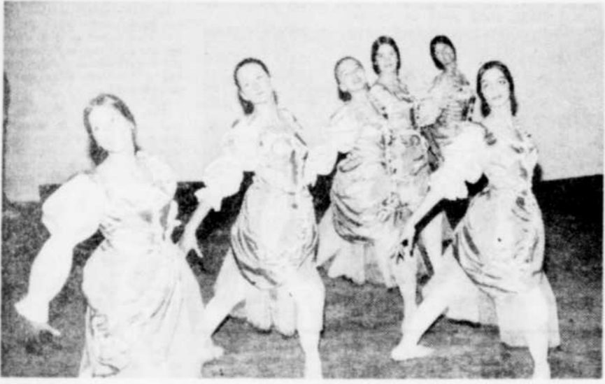
SUCCEs — Encore une fois, la compagnie de Ballets métropolitains a connu un succès éclatant dans la région de l'or blanc. C'est devant une salle comble que les danseurs ont présenté leur spectacle et la foule était très enthousiaste.