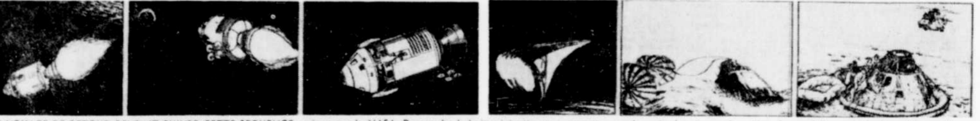
LE VOYAGE DE RETOUR DEVRAIT SUIVRE CETTE SEQUENCE, prévue par la NASA. De gauche à droite: injection transterrestre, sur la voie de retour, séparation des modules, rentrée dans l'atmosphère, chute dans l'océan et récupération... si tout se déroule suivant le plan prévu.

général aucunement leur respiration. Il faudra remédier à cette situation avant que la prochaine mission Apollo soit entreprise, avait-il ajouté. A Houston, on déclare que le revêtement d'étope de verre n'est pas indispensable et qu'il ne sera pas installé sur Apollo-11, qui, en juillet, doit faire débarquer deux astronautes américains sur la lune. Les batteries s'épuisant, les astronautes avaient cessé de transmettre des données téléométriques au centre de contrôle. Snoopy, le petit engin fureteur qui a conduit les deux cosmonautes près de la lune, se trouvait vendredi, à plus de 23.000 milles de la planète autour de laquelle il évoluait en vol autonome, jeudi, pendant plus de huit heures. "Tant que ça" s'étonna Eugene Cernan, pilote du module lunaire, après que le Centre spatial de Houston l'eut informé de la vitesse avec laquelle Snoopy progresse dans l'espace. "Eh qui, lui re-