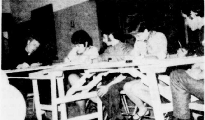
LES JEUNES TRAVAILLEURS de la région de Thetford Mines préparent jeudi soir dernier leur rencontre de la fin de semaine prochaine à Carrefour '69. Cette rencontre se déroulera à Montréal. La photo nous montre quelques membres de la JOC qui préparent ce voyage d'étude.

Le jeune travailleur devra rencontrer lui-même le commanditaire. Durant l'entrevue, il exposera au commanditaire le but de Carrefour '69 et à son retour il s'engage à rencontrer à nouveau le commanditaire pour lui donner un compte rendu de la session d'étude à Montréal.