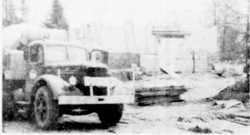
PAVILLON — Le pavillon du Parc de l'Amith sera completé dans quelques semaines. La structure est déjà érigée, le revêtement extérieur est commencé et des ouvriers travaillent actuellement à l'aménagement intérieur.