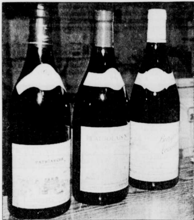
Selon ce qu'annoncent les vins nouveaux de cette année, les Beaujolais qui ne nécessitent pas un long vieillissement devraient attirer l'attention des amateurs au cours des prochains mois.

N'oubliez pas le Château de Rieux, AC Minervois, autre vin dont le rapport qualité/prix en fait un bon achat pour les repas quotidiens (SR — $6.95). Très différent