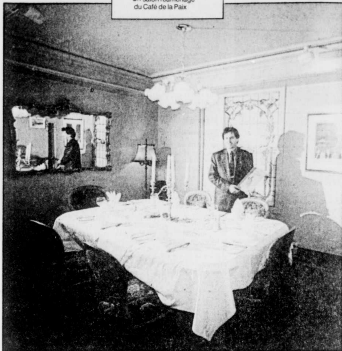
Un salon réaménagé du Café de la Paix