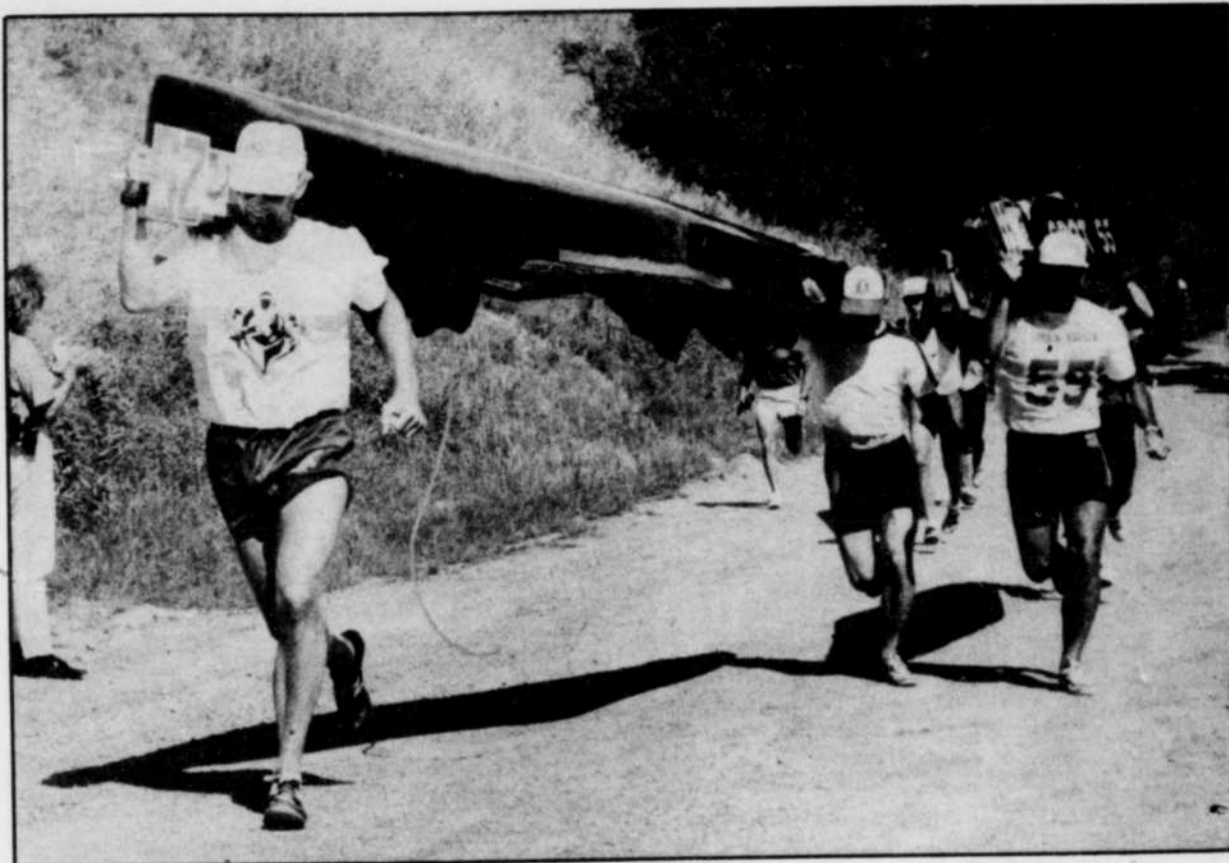
Le portage est sans nul doute l'une des activités les plus spectaculaires de toute la Classique.

De plus, le comité de la Classique tente présentement de mettre sur pied une activité de régates qui se déroulerait à l'île Saint-Quentin. Cette compétition serait secondée par un spectacle de canots de guerre. Le tout reste cependant à confirmer.