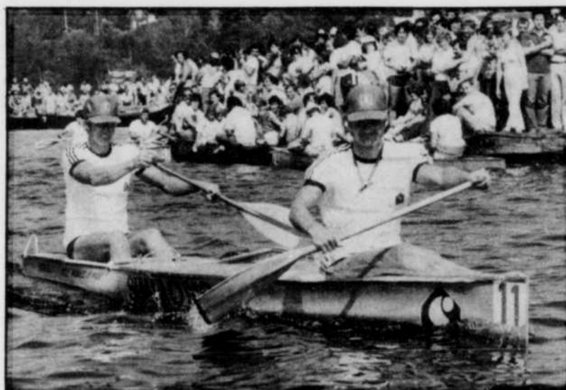
Depuis près de 60 ans, la Classique de canots représente un événement majeur dans la Mauricie.

Jusqu'en 1958, la course s'effectue en deux étapes, sauf pour