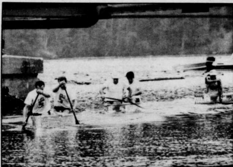
Qui remportera la Triple Couronne...?

En tout, 5800$ américains sont offerts aux gagnants, dont une intéressante bourse de 1000$ dollars attribuée au grand gagnant de l'épreuve.