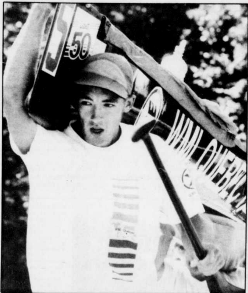
À chaque édition, des dizaines de coureurs démontrent leur détermination et leur courage lors de cette course de 193 kilomètres.