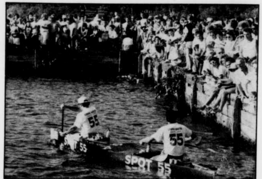
Tout au long de la Classique, les spectateurs pourront participer à une multitude d'activités tout en assistant à un excellent spectacle.