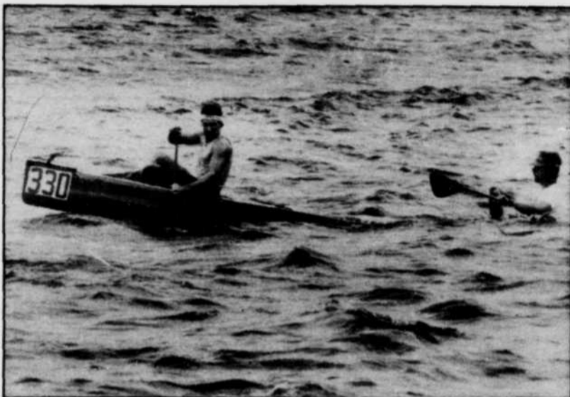
Des canotiers connaissent de petites difficultés au cours de la Classique!

bec), cette étape représente le dernier sprint avant de connaître les grands gagnants de cette Classique... des gagnants épuisés, mais heureux!