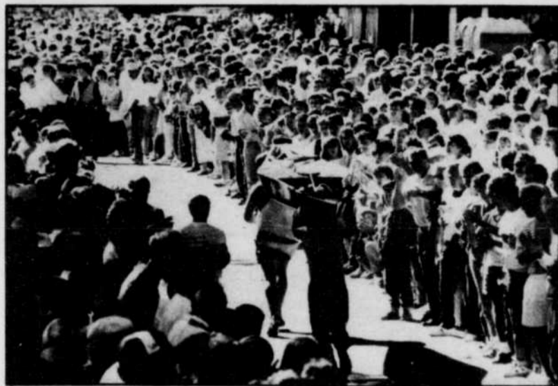
À chaque année, la Classique de canots attire des milliers de spectateurs tout au long du parcours bordant la rivière Saint-Maurice.

Au fil des ans, la Classique de canots de la Mauricie a acquis une renommée internationale. Cette forte popularité est extrêmement avantageuse pour la région mauricienne, et surtout au niveau économique.