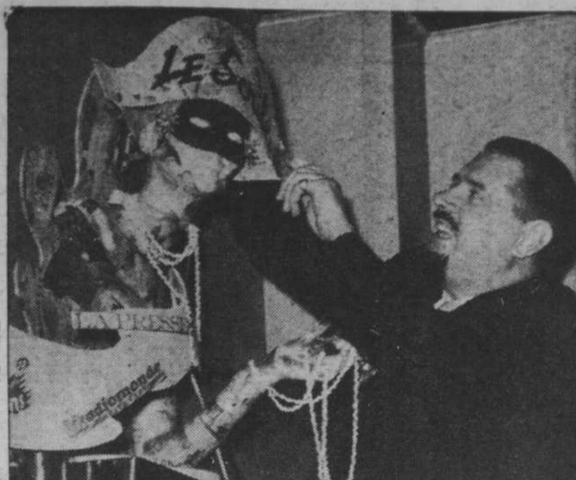
"Les Scribes" ont désormais leur journal bien à eux, publié hebdomadairement. Au cours de la revue de la presse, ils ont coiffé "Anasthasie" de ce gentil chapeau. A noter aussi la bonne place qu'a obtenu "Radiomonde" auprès de la sévère dame!