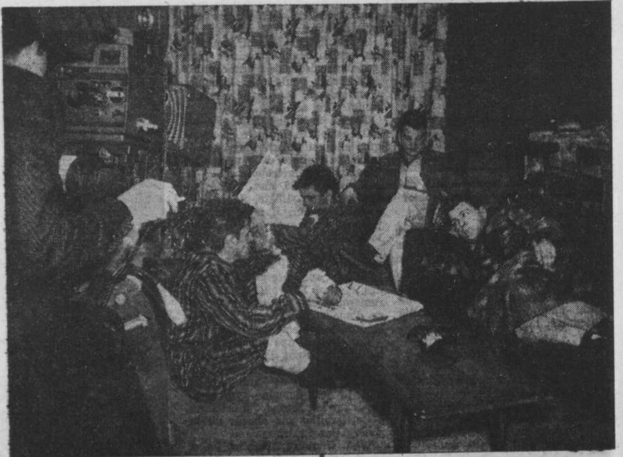
Une dernière scène à tourner avant le vrai champagne.