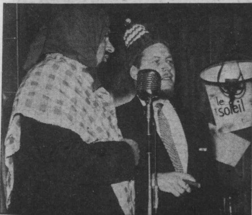
"Viens che-nous, on ira che-vous!"... est un des succès les plus populaires des "Scribes" qui le reprennent parfois lorsque la demande leur en est faite dans l'auditoire. C'est assurément l'une de leurs bonnes chansons.