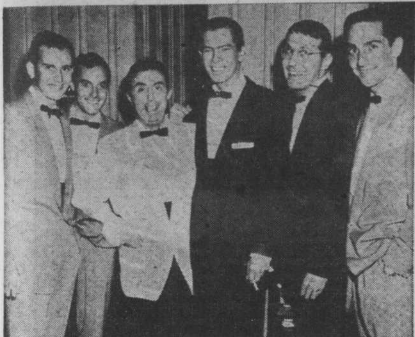
Les plus grands artistes américains, tels que Johnny Ray, photographié ci-haut, se sont empressés d'aller applaudir ceux qui sont dorénavant connus sous le nom de "Rodgers and Hammerstein" français!