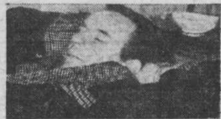
(Doris dormait quand Mme a eu son accident)