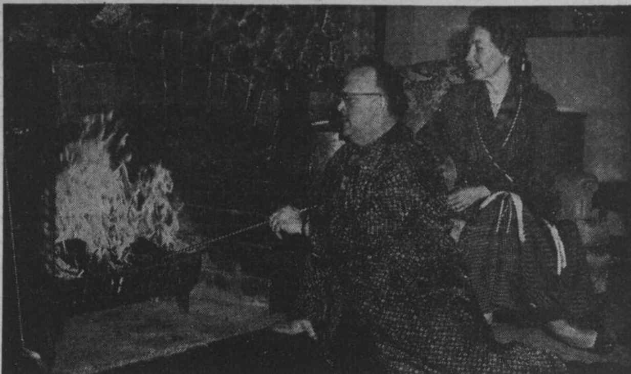
Comme c'est merveilleux, un foyer naturel!