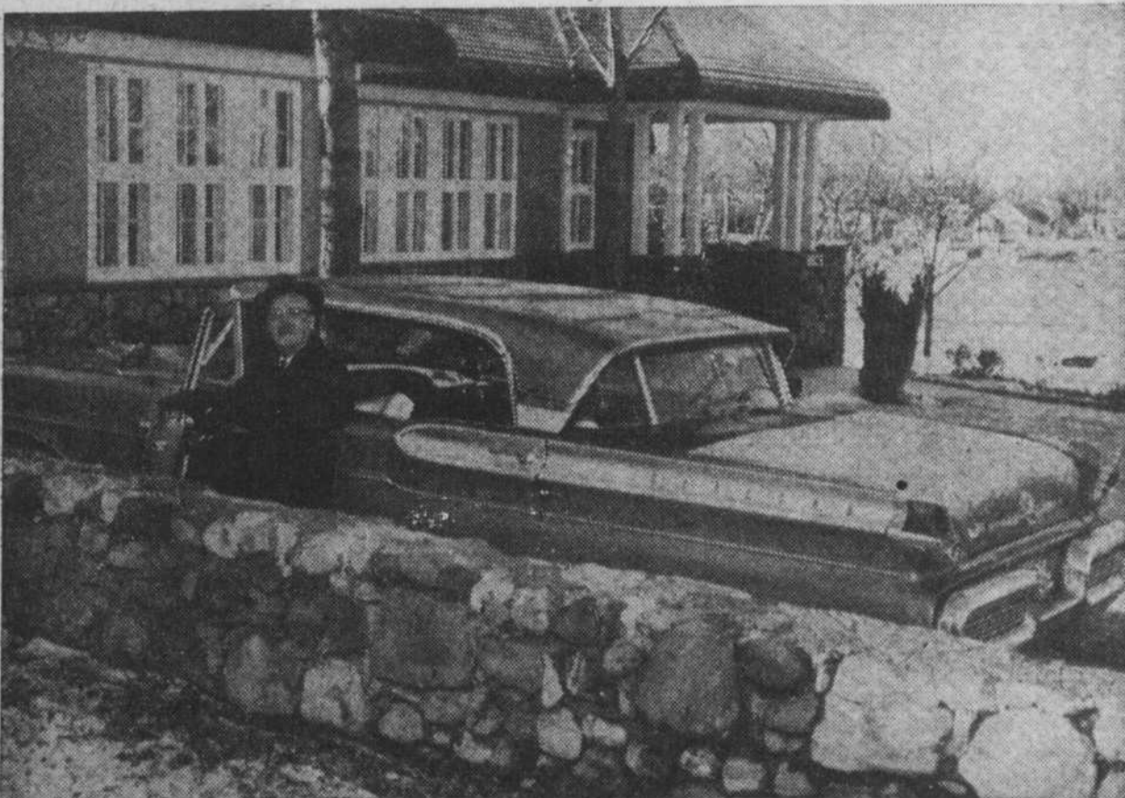
La demeure du vagabond, et sa voiture de pauvre.