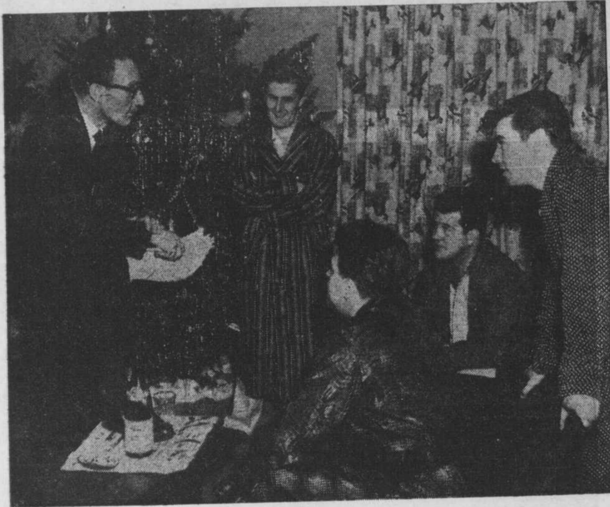
Le script prévoit la g... de bois.

Or, précisément, les Collégiens Troubadours avaient, sinon un événement, du moins une bonne occasion, les petits ennuis de la vie. Un autre Claude, puisqu'ils