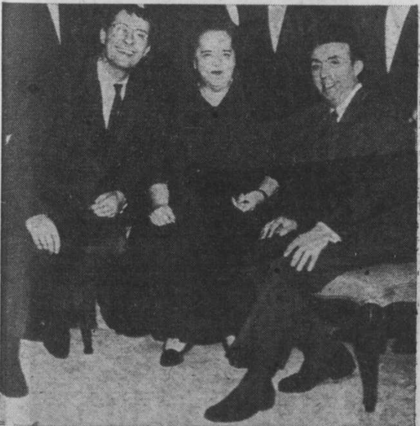
Elsa Maxwell, le critique-bourreau des artistes, ici assise entre Varel et Bailly, n'eut que des éloges à adresser à ces derniers.