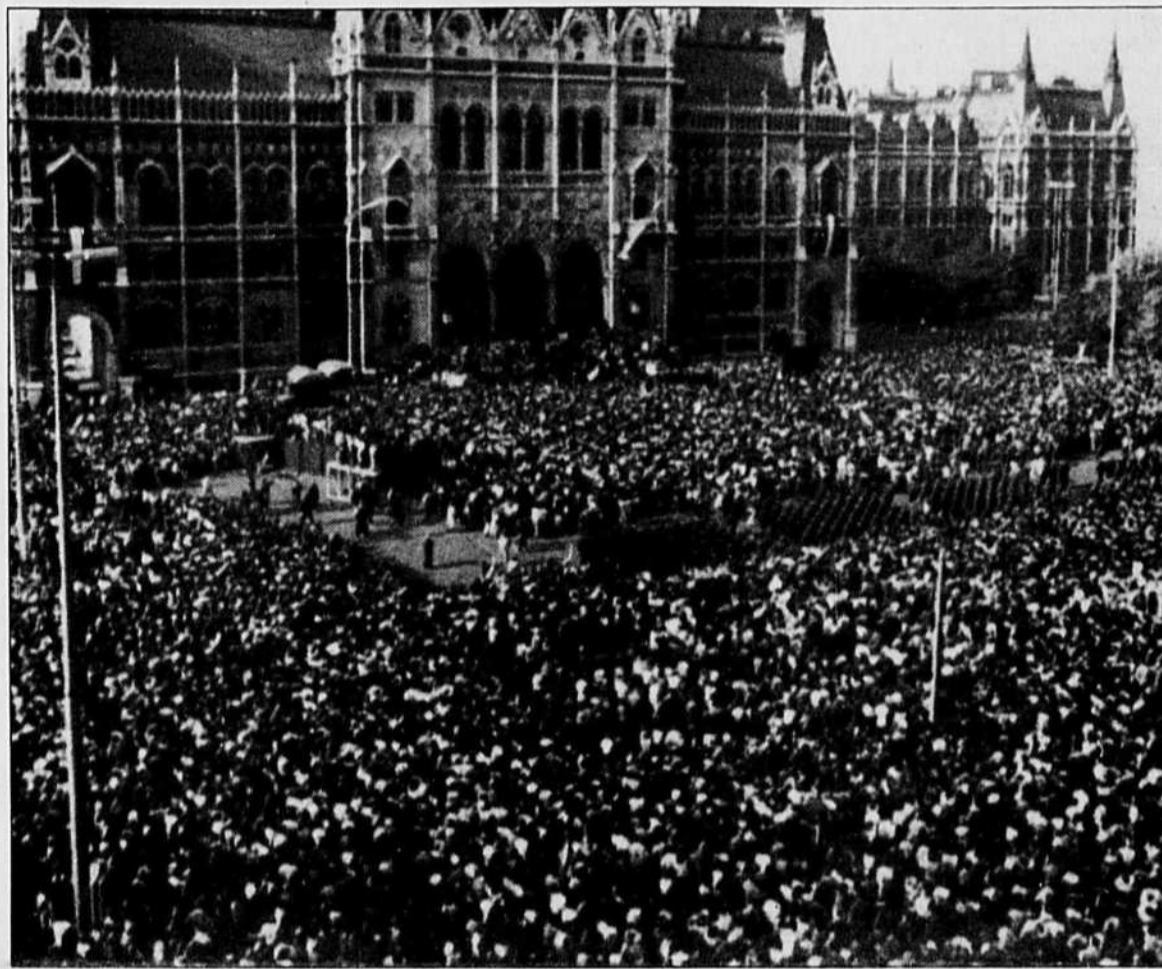
Des dizaines de milliers de Hongrois ont accueilli avec enthousiasme la proclamation de la République de la Hongrie, hier, annoncée publiquement par le président intérimaire Matyas Szuros au balcon du Parlement. Pendant ce temps, 300,000 personnes descendaient dans les rues de Leipzig pour réclamer la démocratie en République démocratique allemande. Page 5.