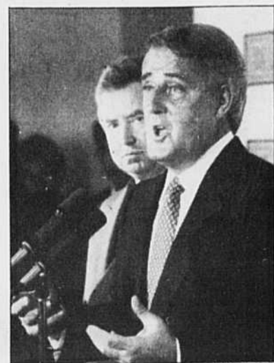
Brian Mulroney et Joe Clark à Kuala Lumpur, hier.

précédent et regrettable dans les annales des Sommets du Commonwealth.