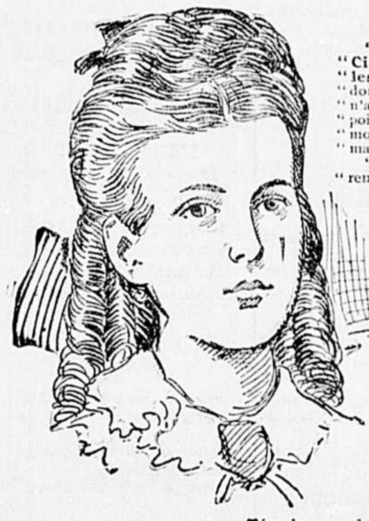
Témoignage de MADEMOISELLE DENIS:

Soyez persévérantes et vous serez récompensées.