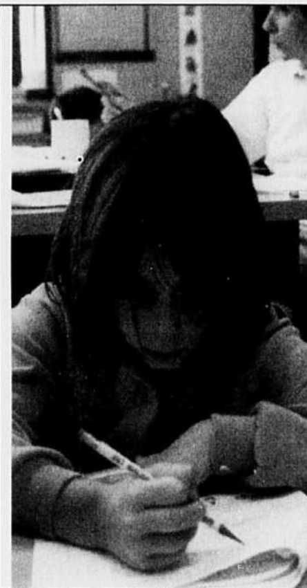
Les parents réclament à grands cris qu'on améliore les cours de langue seconde au primaire.

La première concernée, la ministre Robillard, se refuse, pour l'instant, à faire tout commentaire sur le grand remue-ménage que fait planer le ministre Ryan sur le curriculum du primaire. Elle s'est limitée à retourner aux tirs nombreux lancés par l'opposition à l'Assemblée nationale la semaine dernière. Aucune réponse donnée sur le pourquoi de la voie juridique empruntée par le ministre Ryan, sinon que le gouvernement «veut donner davantage de moyens pédagogiques à nos commissions scolaires pour mieux enseigner la langue seconde au Québec».