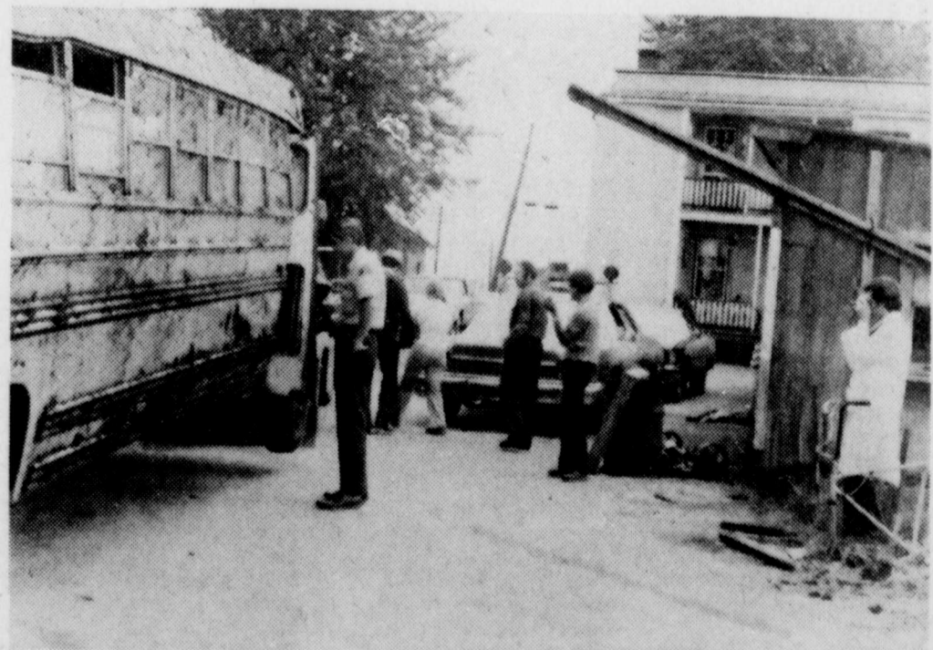
Les inspecteurs ont vérifié de fond en comble le véhicule, hier avant-midi à Louiseville.