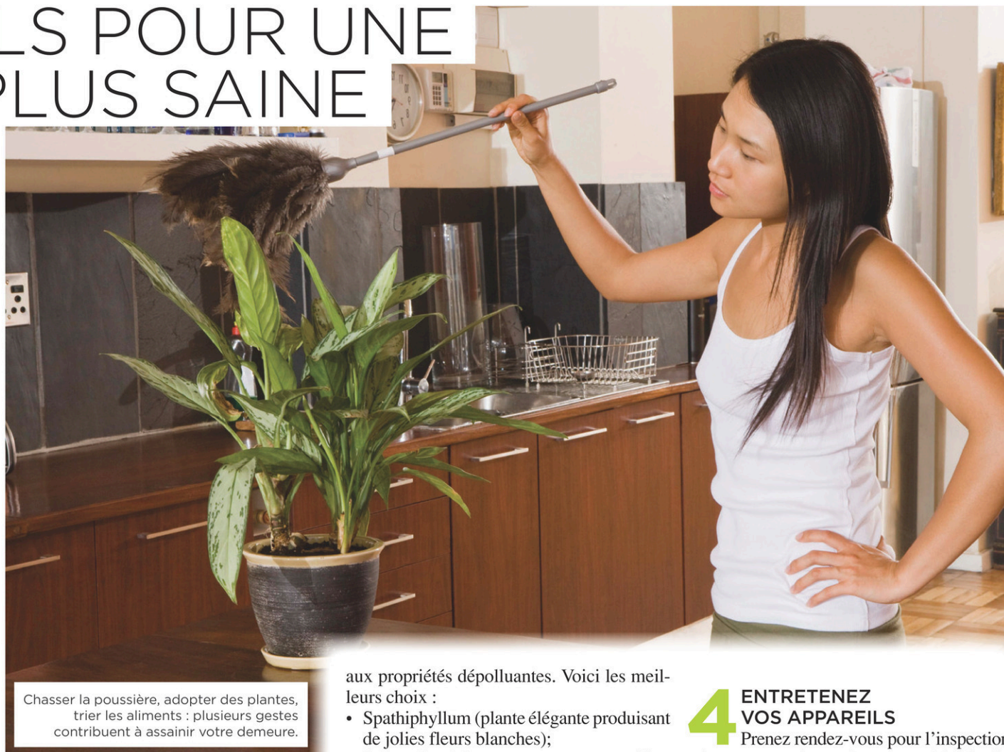
Chasser la poussière, adopter des plantes, trier les aliments : plusieurs gestes contribuent à assainir votre demeure.

Que vous ayez ou non le pouce vert, vous avez tout intérêt à vous doter de plantes