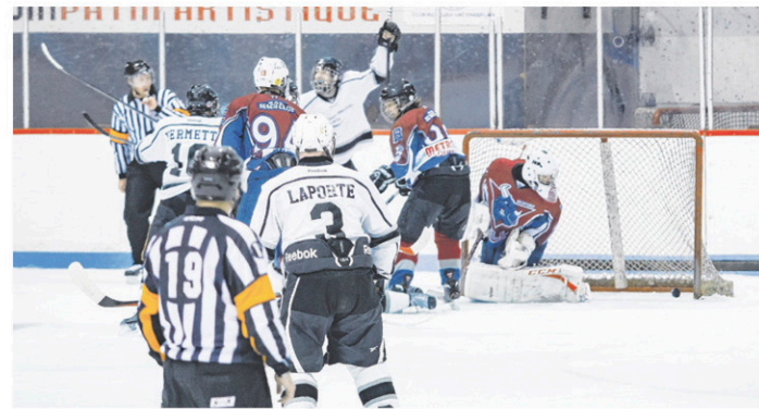
Les Bulls de Bedford (en rouge) n'ont pas été en mesure de répéter leurs exploits de l'an dernier.

GHYSLAIN FORCIER ghyislain.forcier@tc.tc