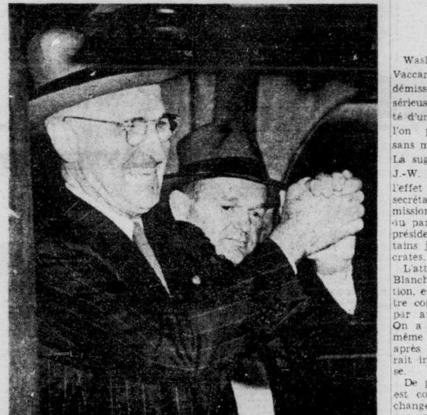
AVANT LES ELECTIONS: La figure épanouie dans un large sourire et les mains jointes en un signe de victoire familier aux boxeurs, le président HARRY S. TRUMAN pose ici, au moment où il se dirige vers sa ville natale de Independence, Missouri, pour y déposer son bulletin de vote aux élections d'avant-hier qui donneront au parti républicain le contrôle de la Chambre des Représentants et du Sénat, pour la première fois depuis 15 ans.

La suggestion du sénateur démocrate Fulbright "n'est pas même digne de commentaires", dit-on dans l'entourage du président des Etats-Unis— Une décision importante à prendre