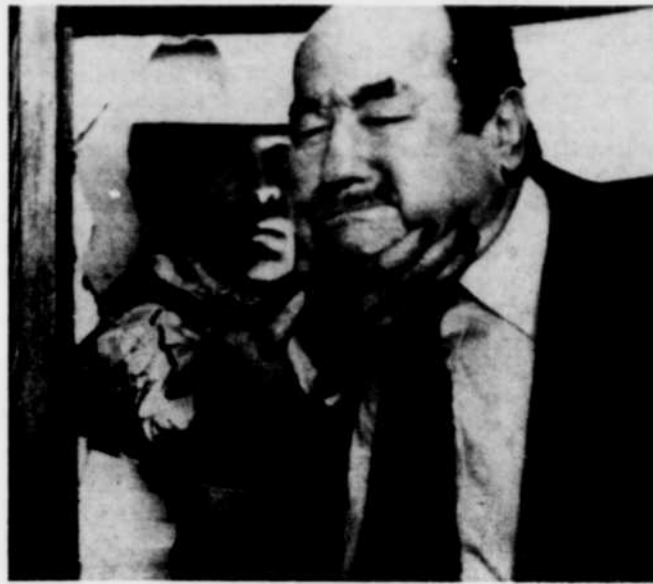
Broderick Crawford et Robert Powell dans "Harlequin" de Simon Wincer.

ques à l'usage des spectateurs friands d'émotions fortes. Lors d'un entretien que le cinéaste a accordé aux journalistes, il a exprimé sa volonté de dépeindre "un univers où l'irréel l'emporte sur le monstrueux, et la poésie sur le drame bon marché". Ceci dit, il faut bien reconnaître que, pour réaliser ce film, qui s'inscrit dans